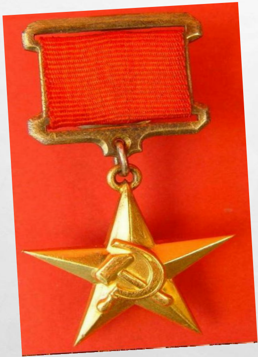
Награда «Золотая звезда»