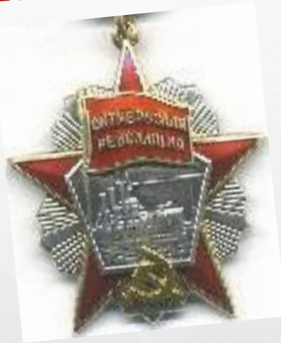
Орден «Октябрьской революции»