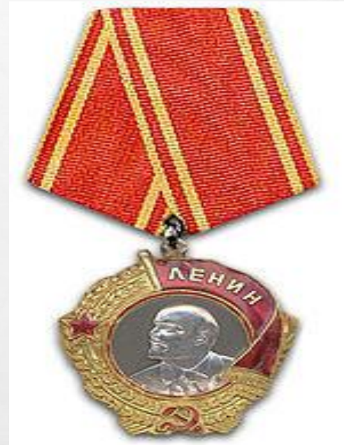
Награда «Орден Ленина»