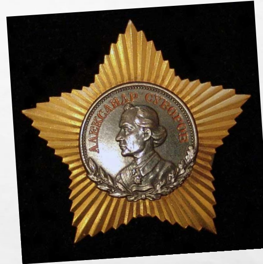
Орден «Суворово 2 степени»