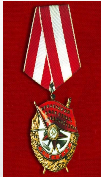
Орден красного знамени