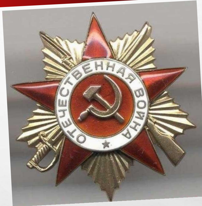
Орден Отечественной войны 1 степени