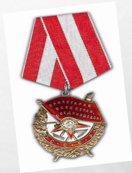
5 Орденов «Красного знамени»