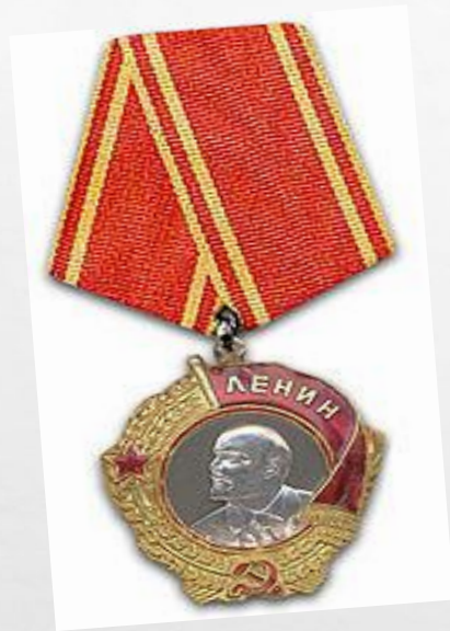
4 Ордена Ленина