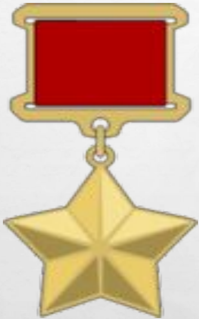
Награда «Героя советского союза»