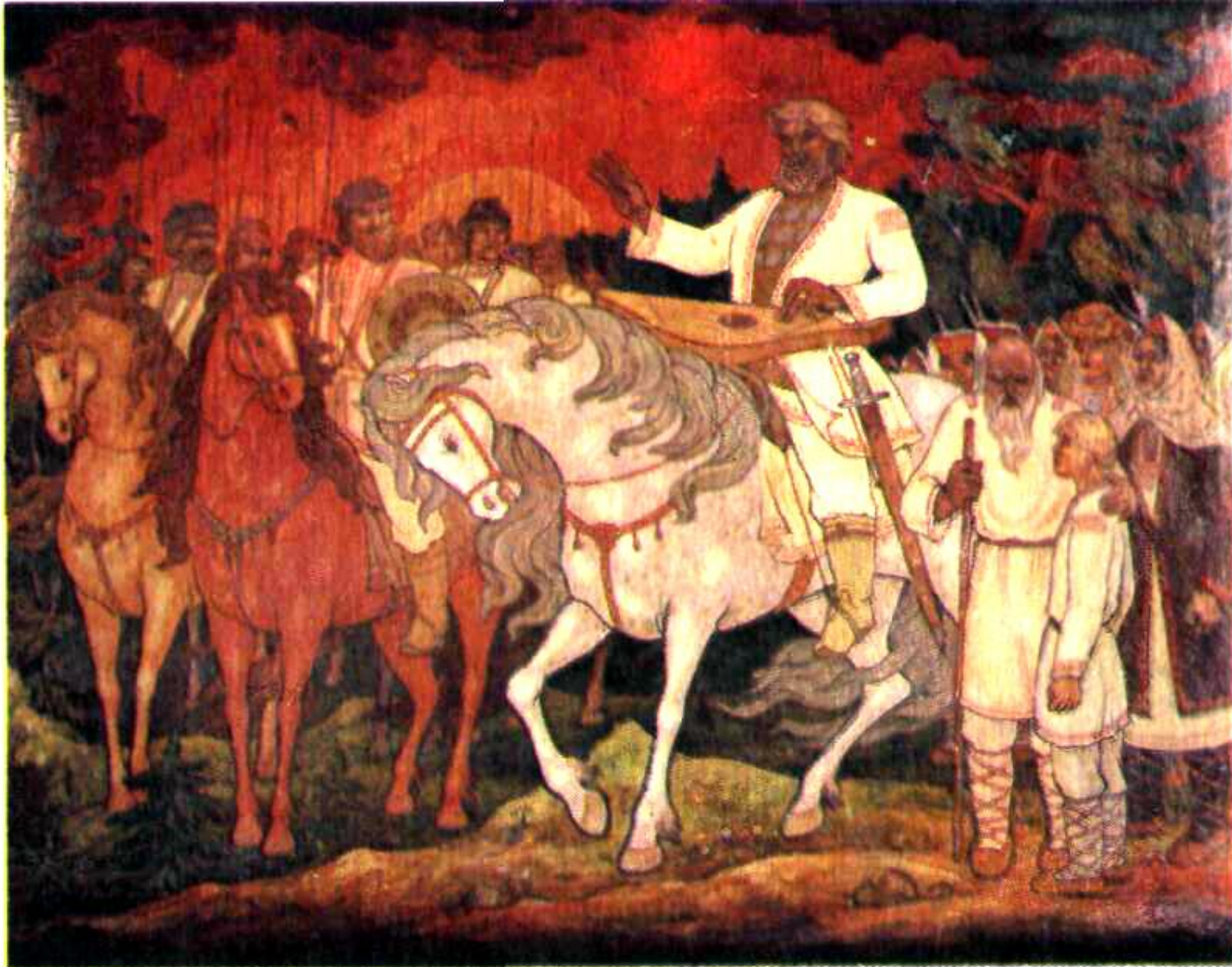
«ЛЕГЕНДА ОБ АКПАРСЕ» (лаковая миниатюра Б. Буляков.)