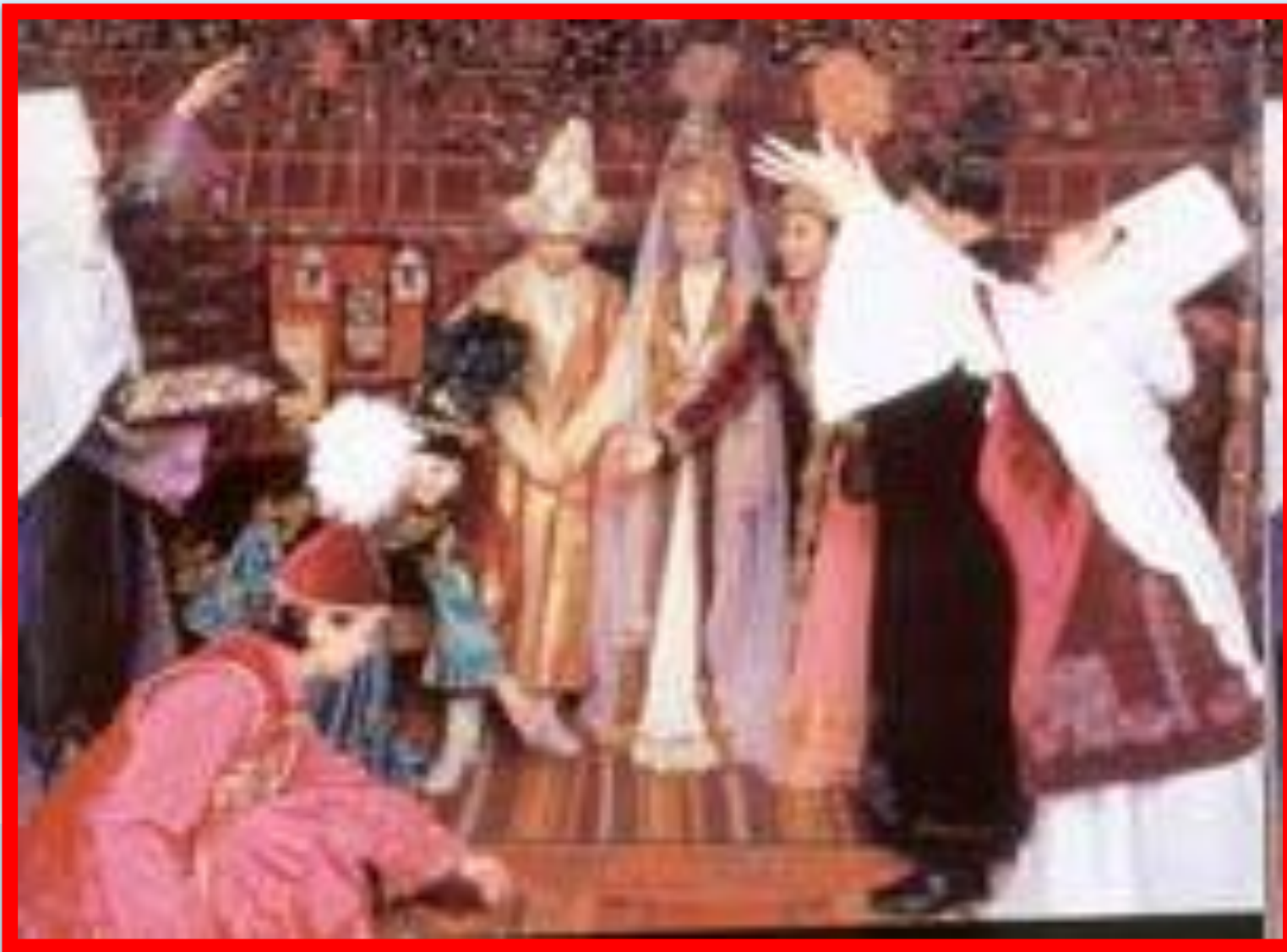
Сватовство Куда тусу