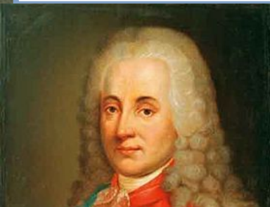
Д.М. Голицын Действительный тайный советник