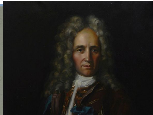
Г.И. Головкин Президент коллегии иностраннных дел