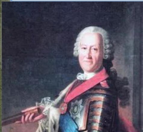
Генерал- фельдмаршал М.М. Голицын