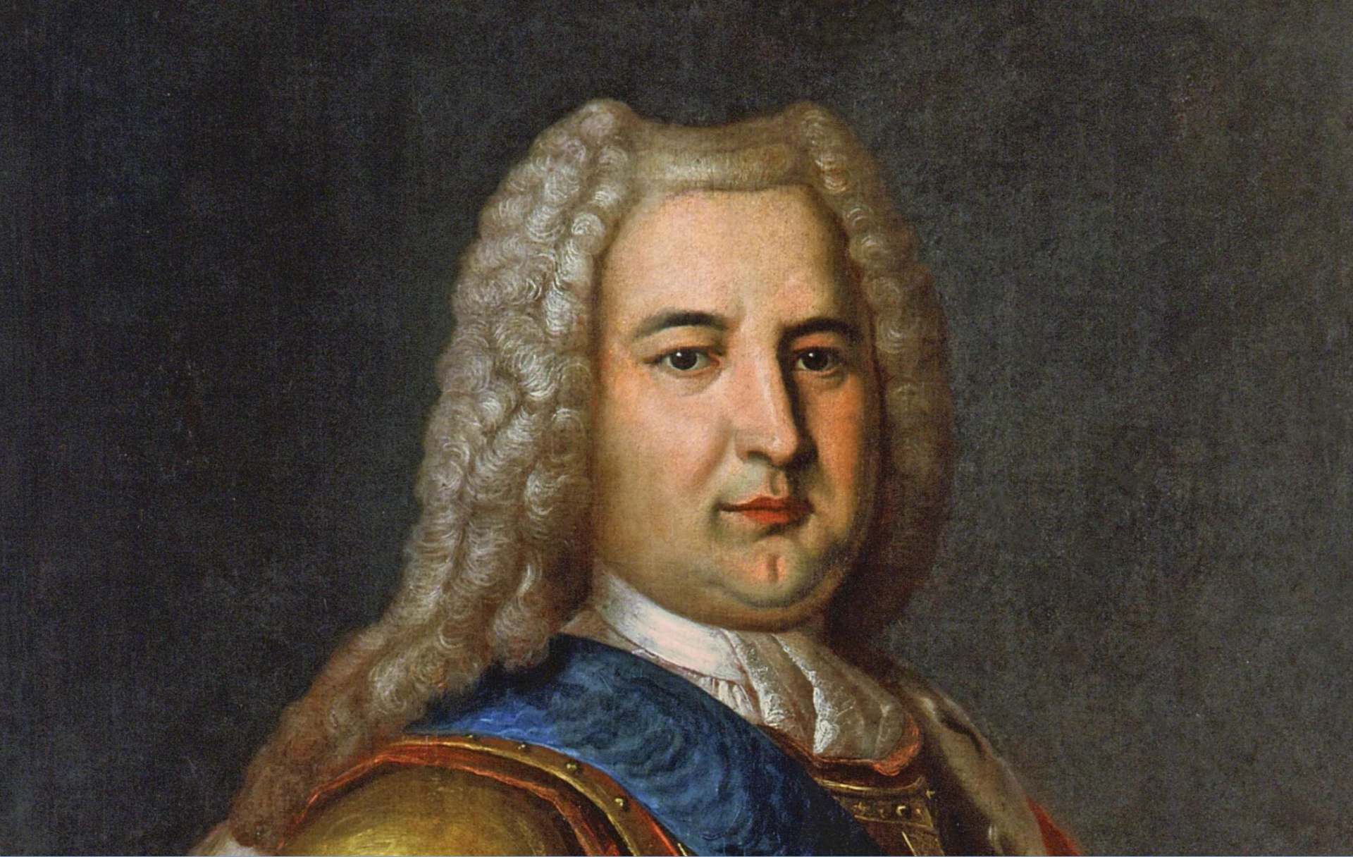
Эрнст Иоганн Бирон