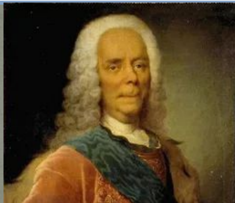
Генерал- фельдмаршал Г.И.