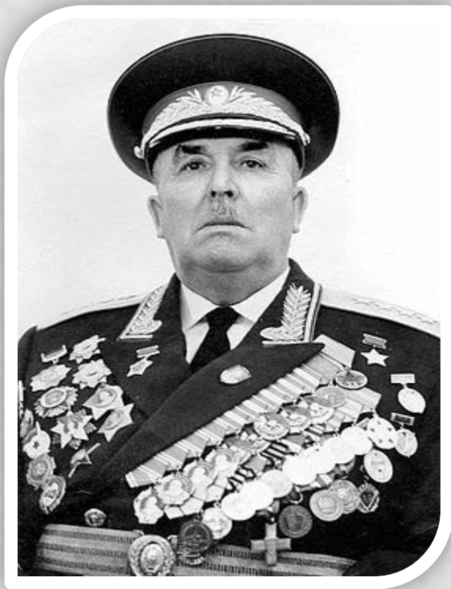
Ива́н Ива́нович Федю́нинский (30 июля 1900 года — 17 октября 1977 года) — советский военачальник, генерал армии. Герой Советского Союза.