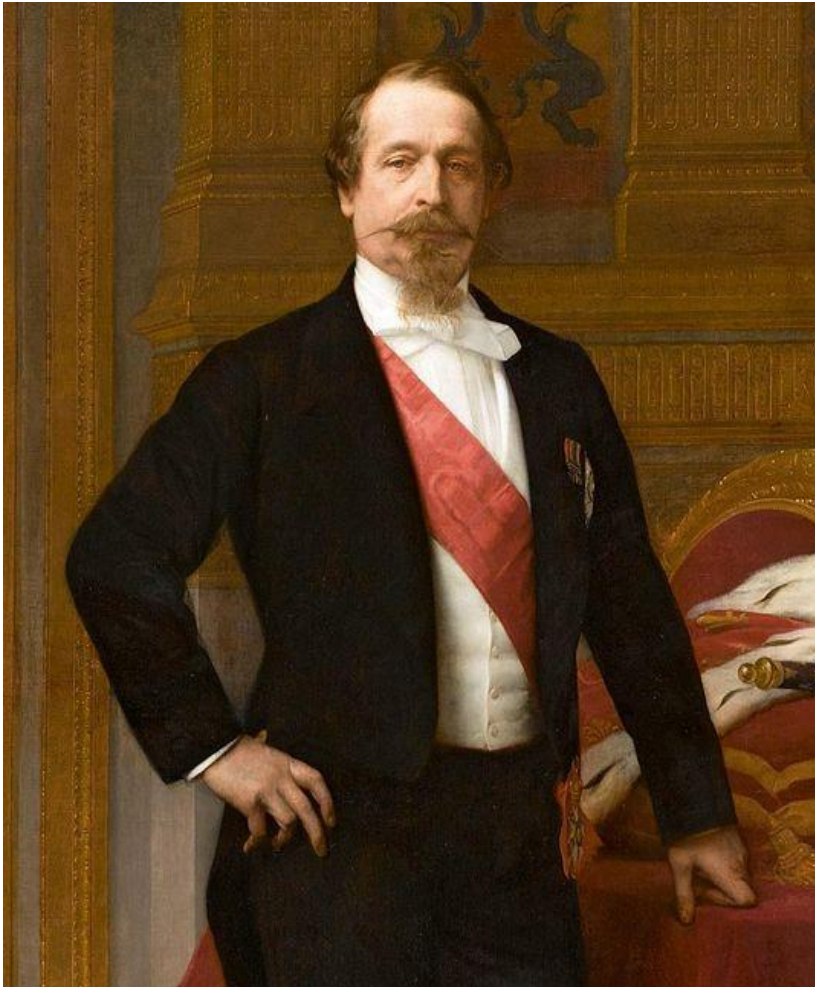
Луи Бонапарт (Наполеон III)