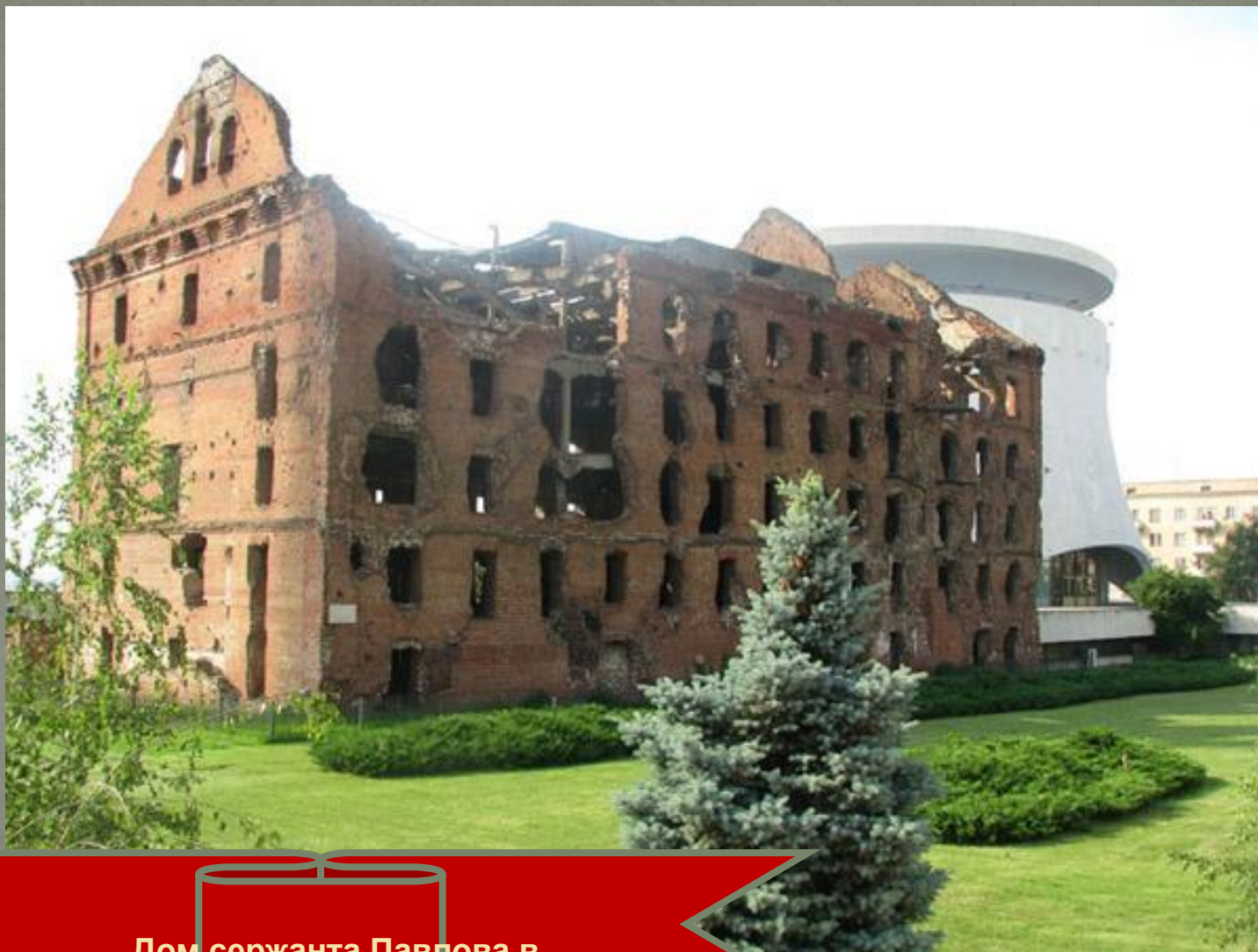
Дом сержанта Павлова в Сталинграде

Как называется это здание и где оно находится?