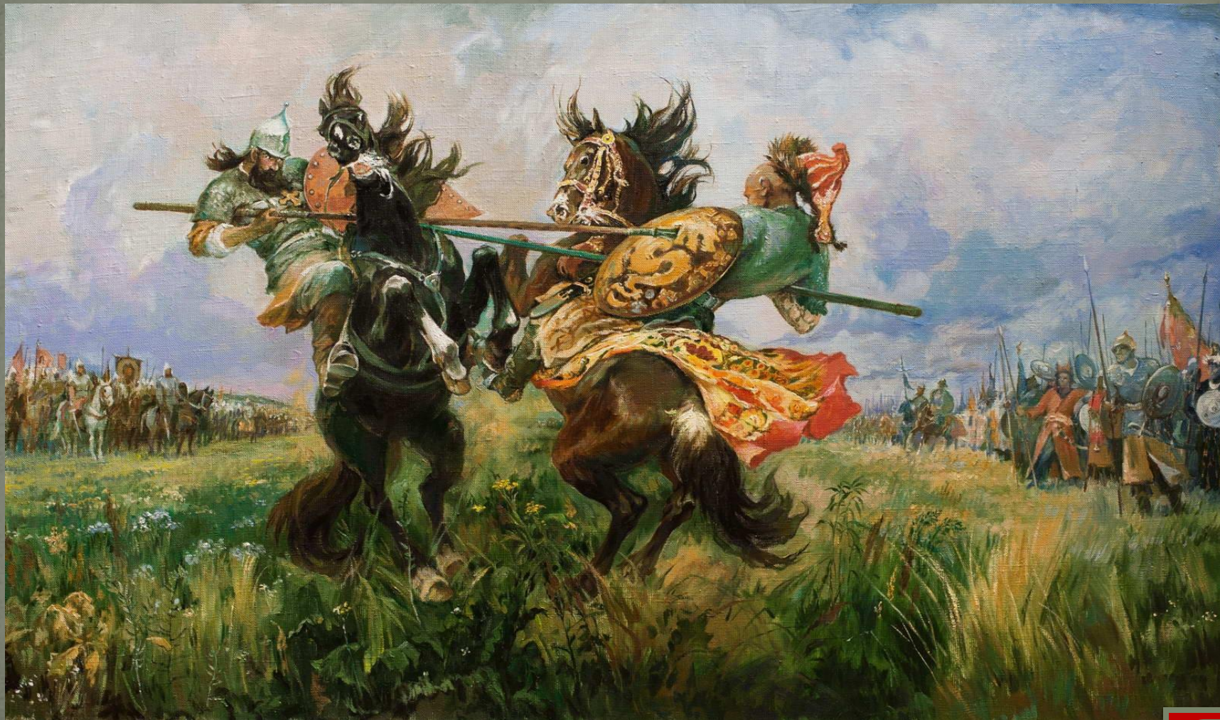
Пересвет и Челубей