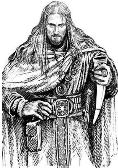
Викинг Харальд Суровый