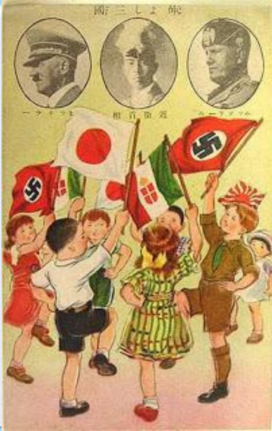
Японский плакат, посвященный подписанию Тройственного пакта