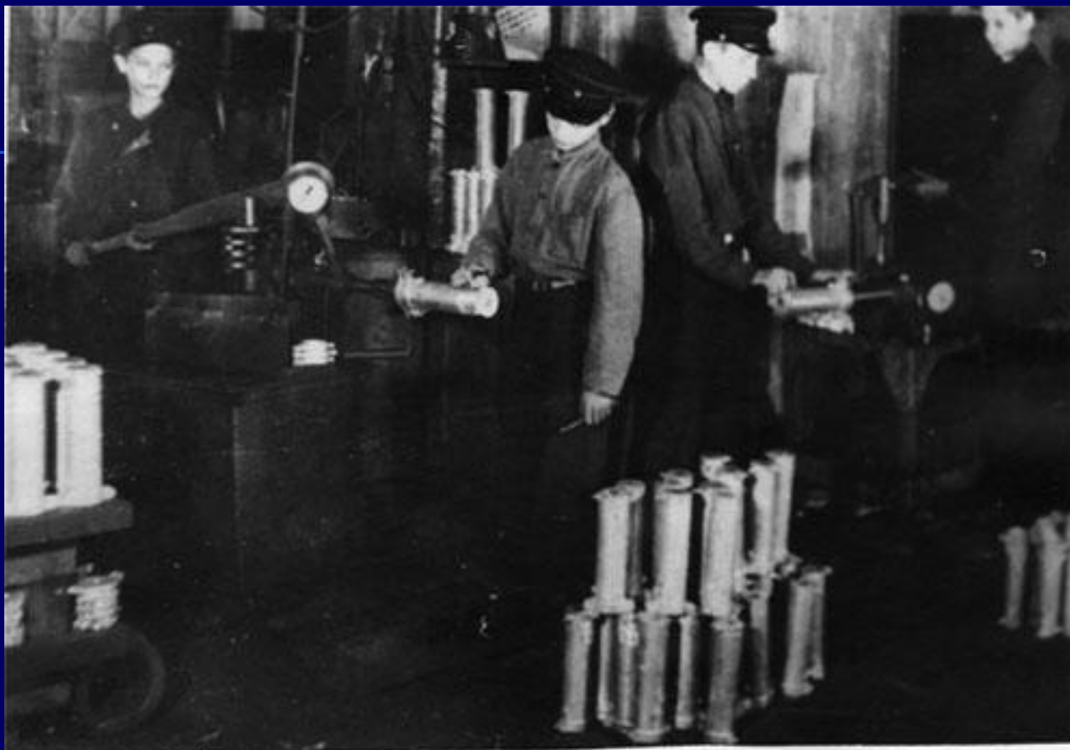
1943 год. Гидравлическое испытание фильтров.