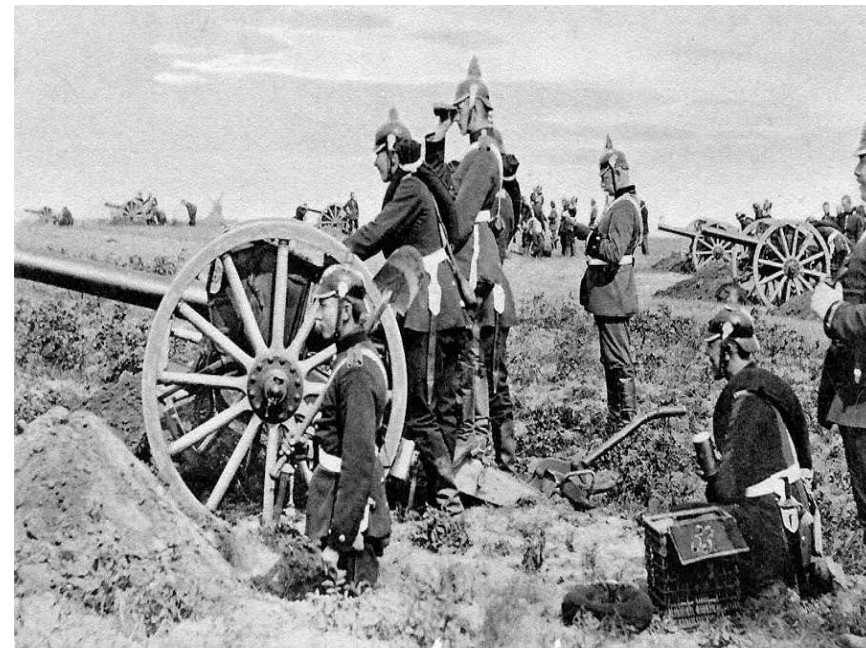
Дальнобойная пушка Круппа