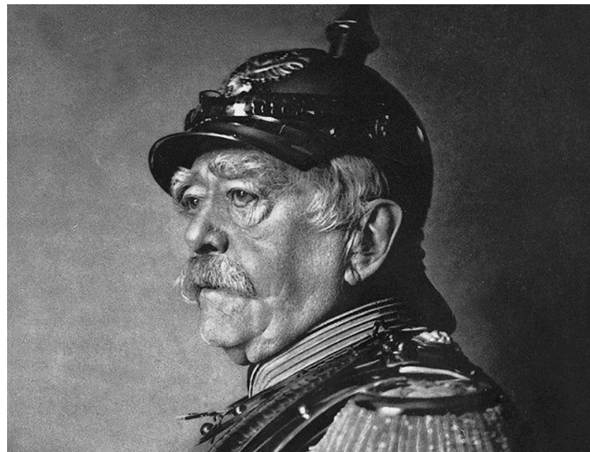
Отто фон Бисмарк – канцлер Германии