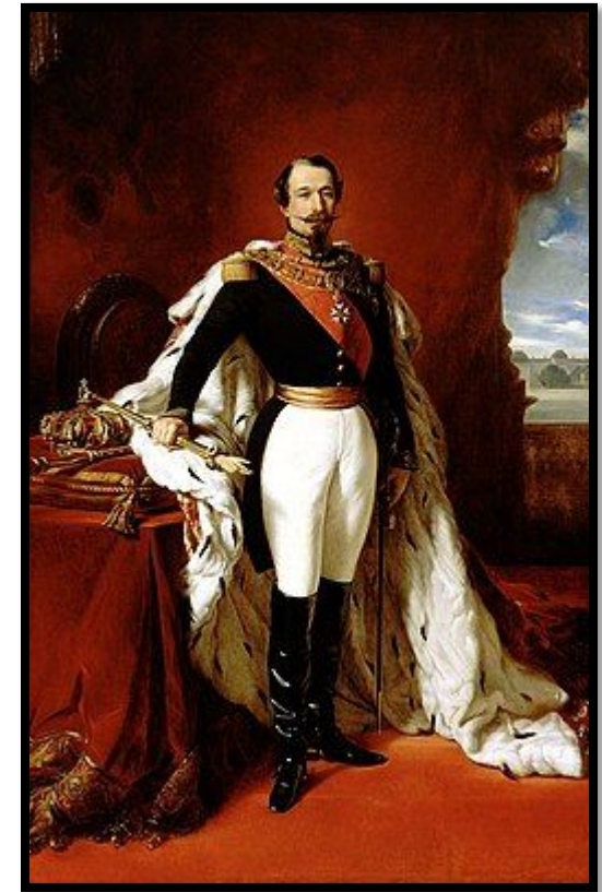
Вторая империя 1852-1870 гг. - период диктатуры Луи Наполеона Бонапарта (Наполеона III) во Франции.