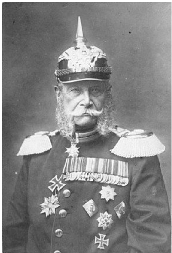
Вильгельм I – германский император 1871-1888 гг.