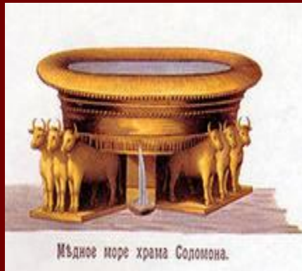
Мѣдное море храма Соломона.