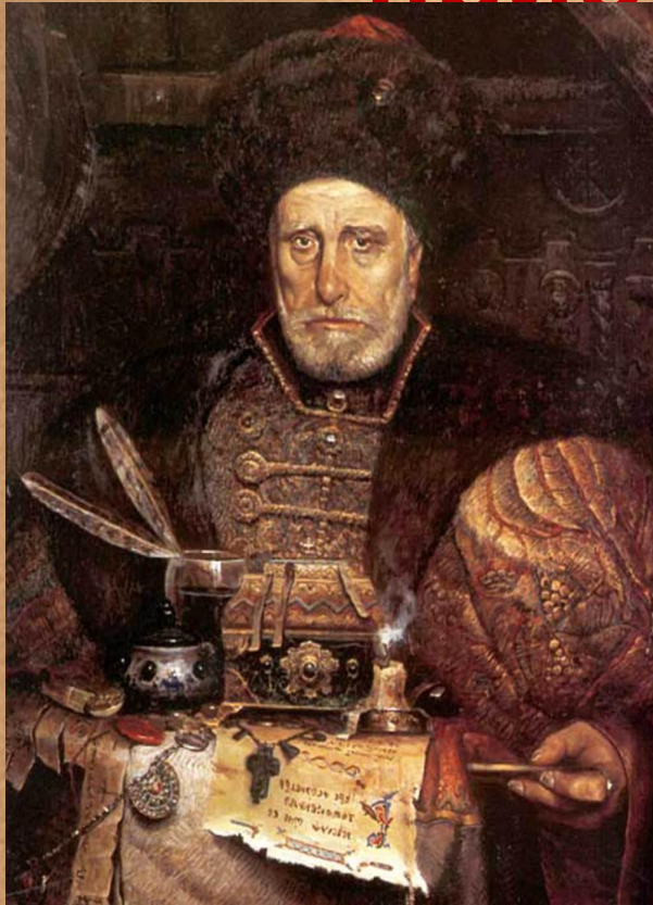
Андрей Михайлович Курбский (1528 -1583 гг.)

Боярин, воевода, один из активных деятелей Избранной рады