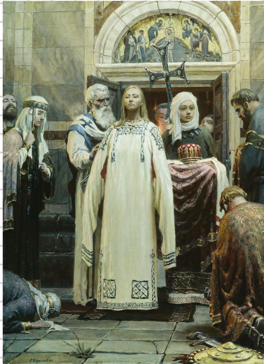
Крещение Ольги, 957 г.