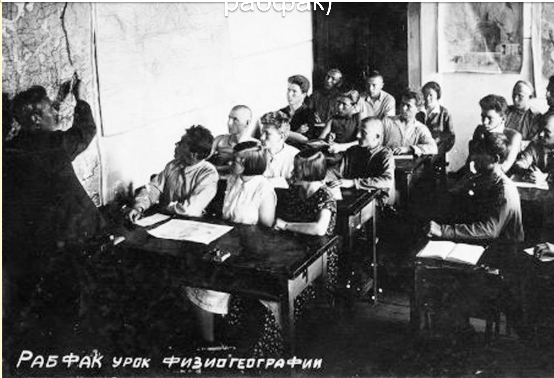
РАБФАК УРОК ФИЗИОГЕОГРАФИИ