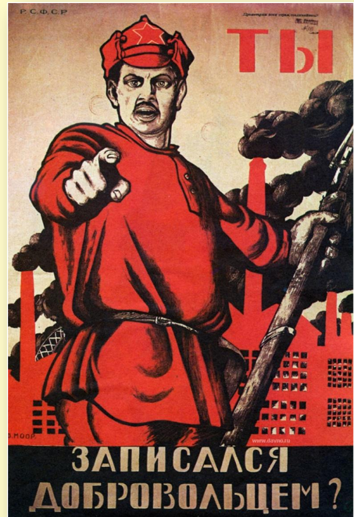
Д. Моор «Ты записался добровольцем?»