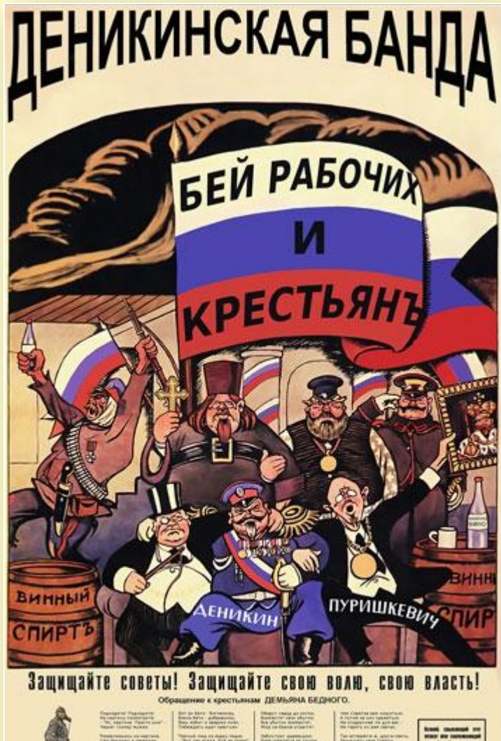
В. Дени «Банда»