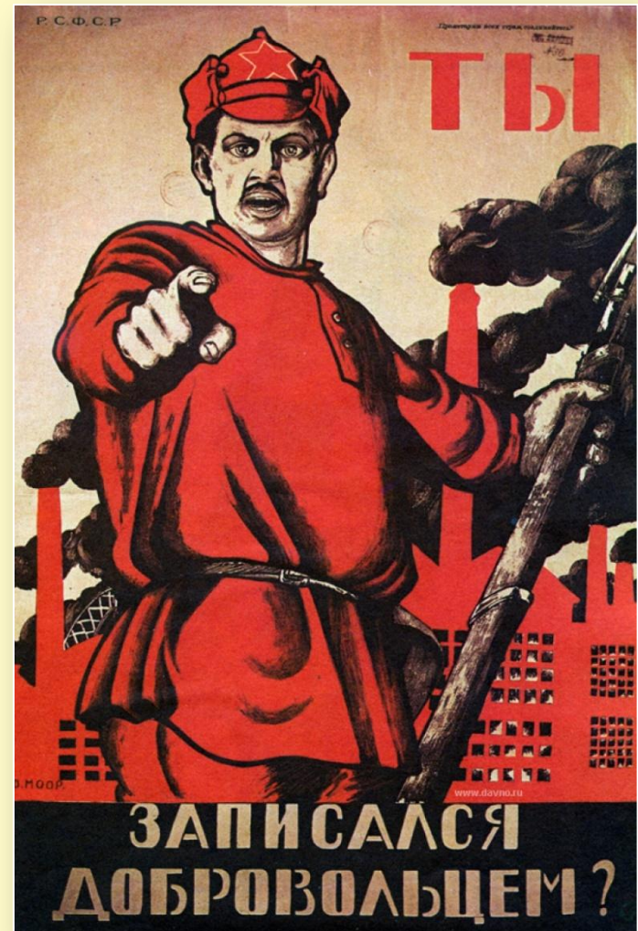
Д. Моор «Ты записался добровольцем?»