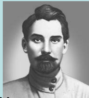
Буденный Сталин Тухачевский Щорс