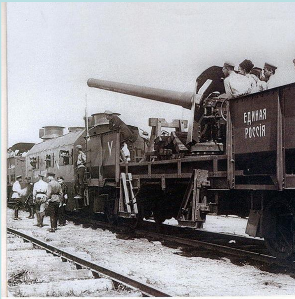
Бронепоезд «Единая Россия»