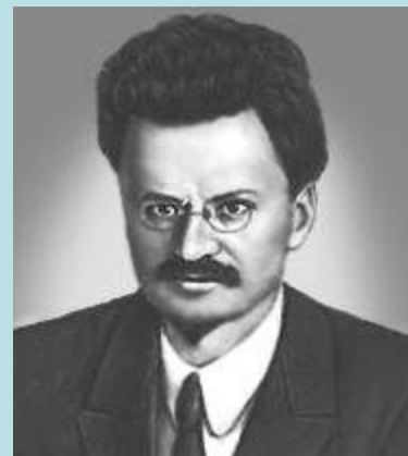
Чапаев Ворошилов Фрунзе Троцкий