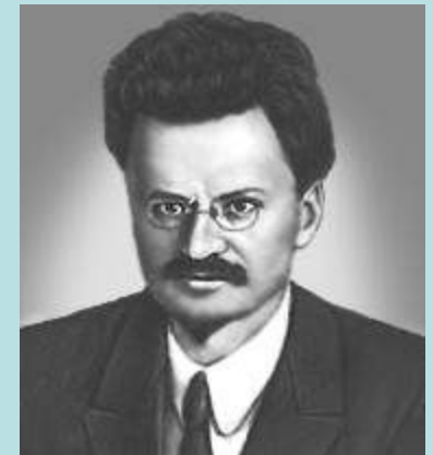
Чапаев Ворошилов Фрунзе Троцкий