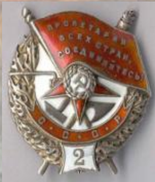
Орден Красного знамени