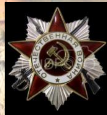
Орден «Отечественная война»