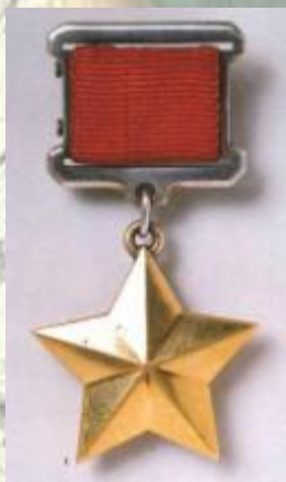
Медаль «Золотая звезда»