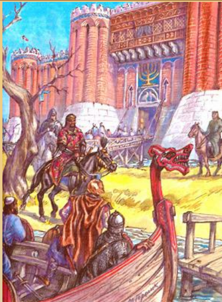
М. Горелик. Корабль руссов у дворца хазарских каганов