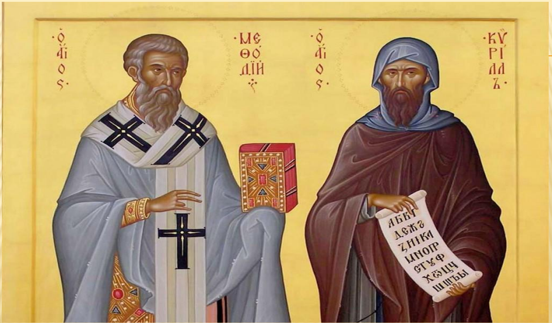
СОЗДАТЕЛИ СЛАВЯНСКОЙ АЗБУКИ – КИРИЛЛ И МЕФОДИЙ