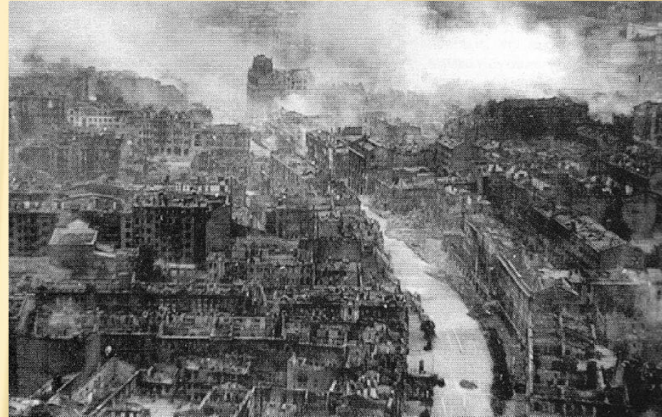
Руины Киева к сентябрю 1941 года.

В немецком окружении оказались 452,7 тыс. человек, 2642 орудия, 1225 минометов, 64 танка. По немецким данным под Киевом к 24 сентября было взято в плен 665 тыс. человек.