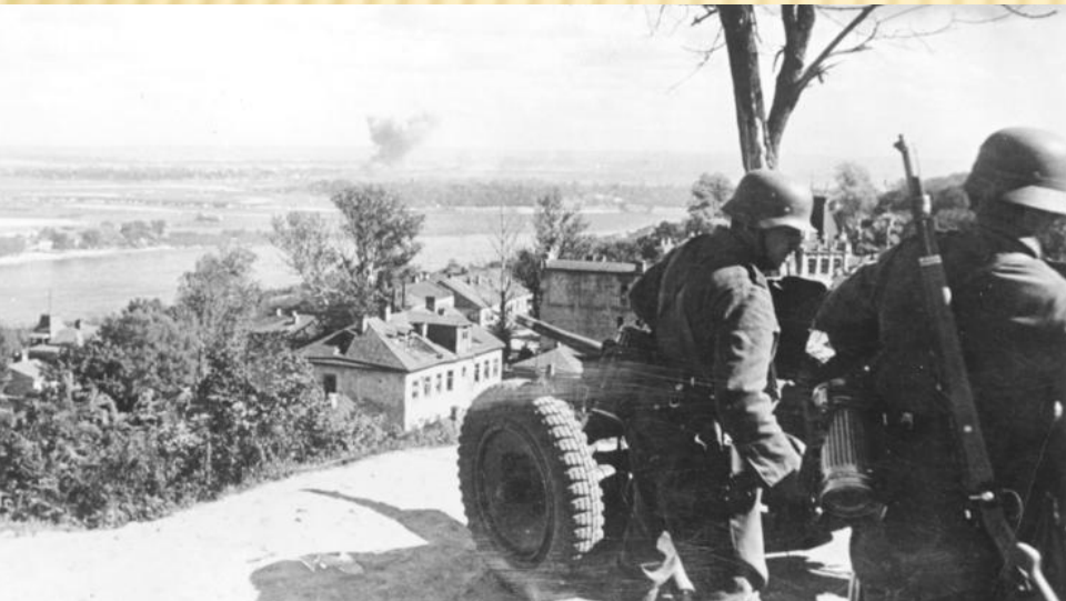
Немецкая позиция на берегу Днепра.