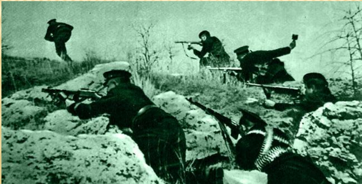
Моряки на рубежах Одессы.

Одесса оборонялась войсками Отдельной Приморской армии, силами Одесской военно-морской базы и Черноморского флота при активной помощи населения города против немецко-румынских войск (4-й румынской армии, 72-й немецкой пехотной дивизии и сил люфтваффе), окруживших Одессу с суши. Сравнительно небольшим силам обороняющихся удалось отражать удары значительно превосходящих сил противника. Снабжение города осуществлялось транспортными судами и боевыми кораблями Черноморского флота. Последние также поддерживали оборону огнём своих орудий. Однако итогом стало отступление советских войск из Одессы 16 октября 1941 года. Части приморской армии, переброшенные в Крым приняли участие в тяжёлых оборонительных боях в Крыму, отступили в Севастополь и участвовали в обороне Севастополя.