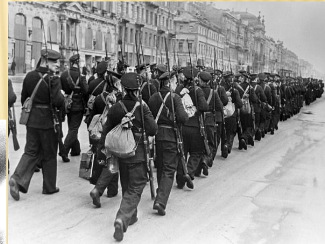
Моряки идут на фронт по улицам Ленинграда, октябрь 1941