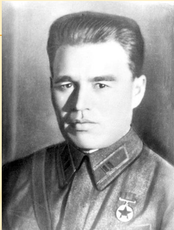
Майор П. М. Гаврилов. 23 июля 1941 года тяжело раненым в бою попадает в плен. Содержался в лагерях Хаммельбург и Равенсбрюк до мая 1945 года. В 1957 году получил звание Героя Советского Союза.