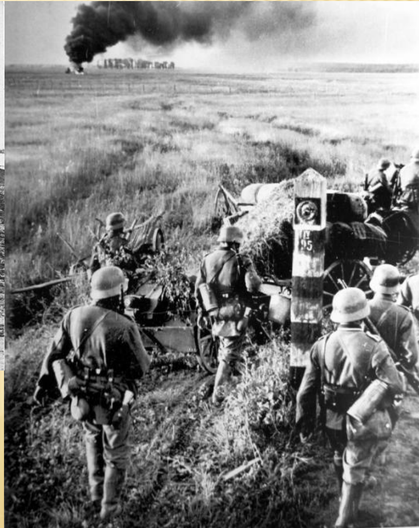
Немецкие войска переходят границу СССР.