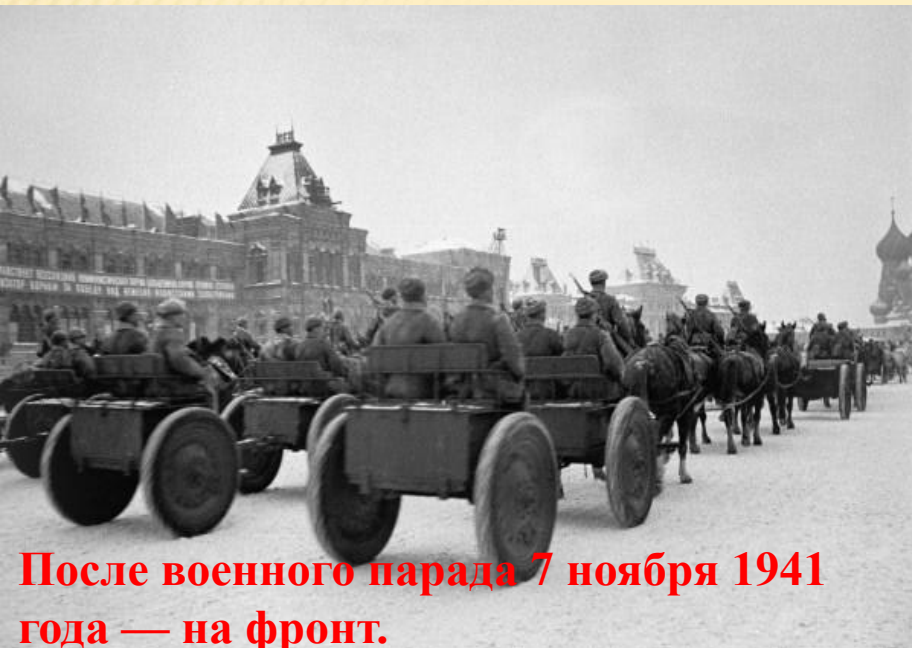
После военного парада 7 ноября 1941 года — на фронт.