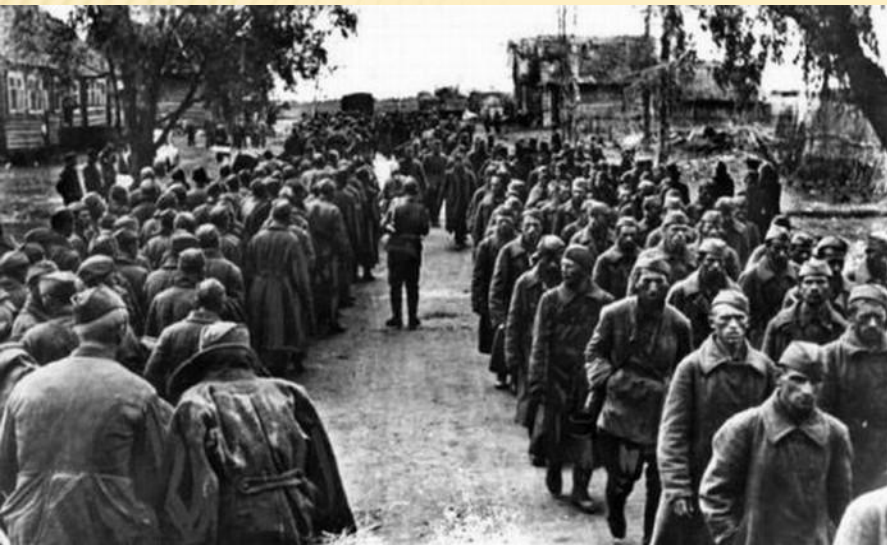
Колонны советских военнопленных под Старой Руссой (1941г.)