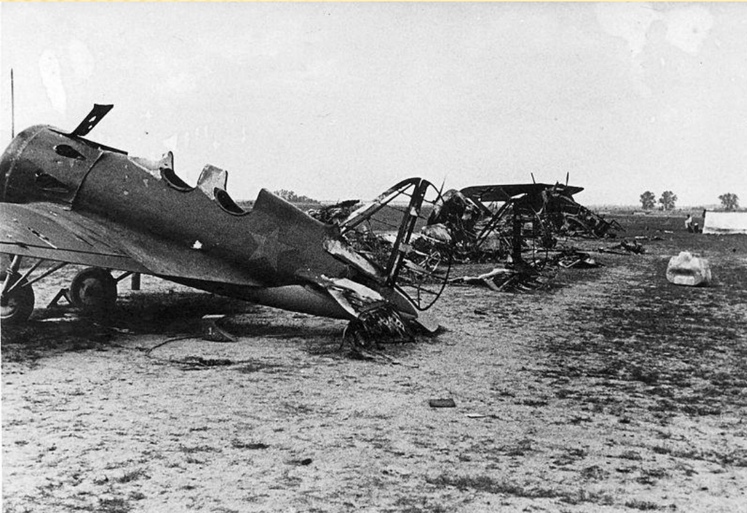
Разбитый советский аэродром.

22 июня в 12 часов дня Молотов выступил по радио с официальным обращением к гражданам СССР, сообщив о нападении Германии на СССР и объявив о начале отечественной войны.