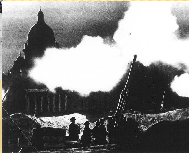
Отражение авианалёта на Ленинград. 1941