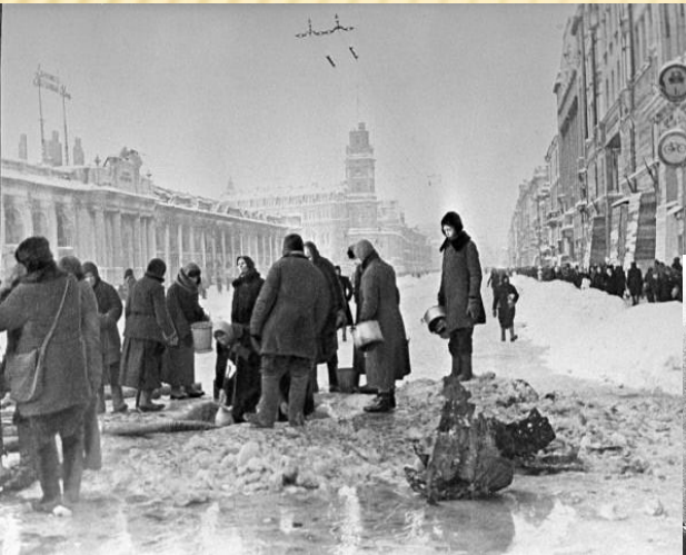
Горожане набирают воду, из пробоев в асфальте на Невском проспекте, декабрь 1941

Блокада Ленинграда — военная блокада Ленинграда (ныне Санкт-Петербург) фашистскими войсками. Блокада началась с 8 сентября 1941 года, когда солдаты группы «Север» захватили город Шлиссельбург (Петрокрепость), взяв под контроль исток Невы и блокировав Ленинград с суши. С этого дня началась длившаяся 872 дня блокада города. Были разорваны все железнодорожные, речные и автомобильные коммуникации. Сообщение с Ленинградом теперь поддерживалось только по воздуху и Ладожскому озеру. Сохранилось лишь единственное железнодорожное сообщение с побережьем Ладожского озера с Финляндского вокзала — «Дорога жизни». Общая площадь взятых в кольцо Ленинграда и пригородов составляла около 5000 км 2