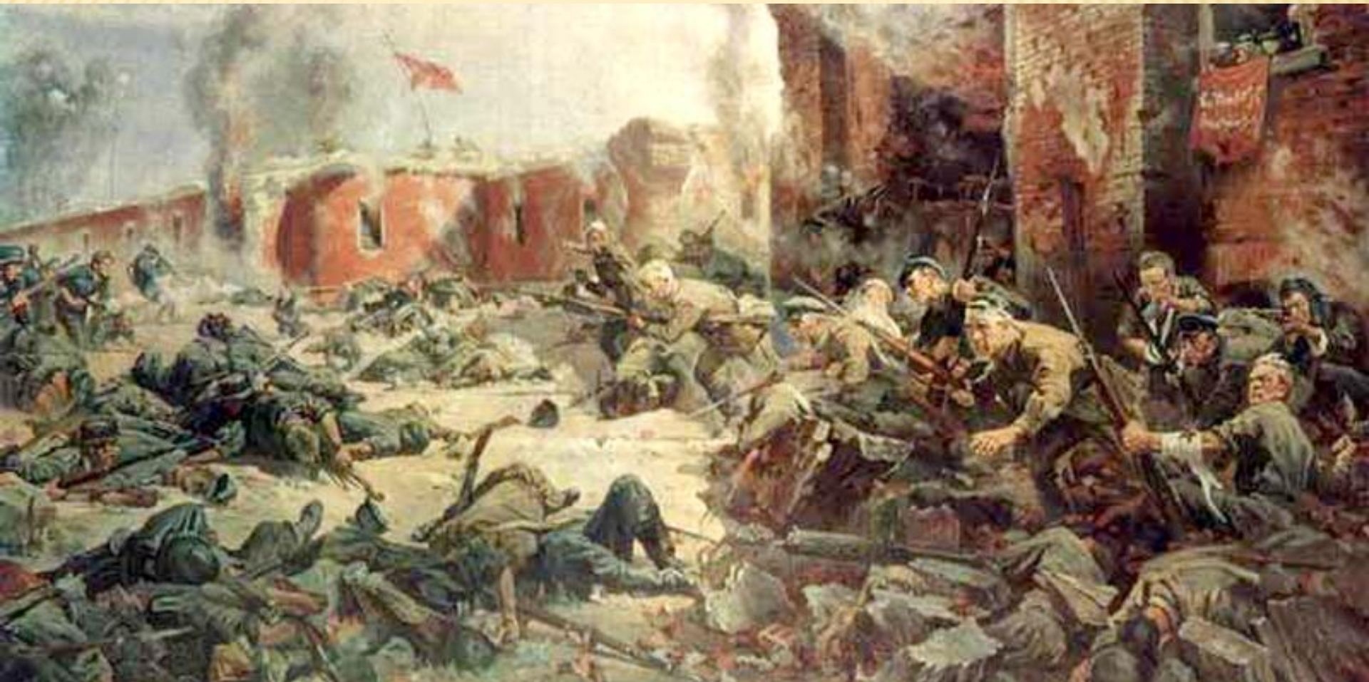
Защитники Брестской крепости, картина Петра Кривоногова.

Крепость, которая на начало войны не имевшая стратегического значения, предполагалось немецким командованием взять за несколько часов, однако блокированные и разрозненные части Красной армии организованно продержались до конца июля 1941 г.