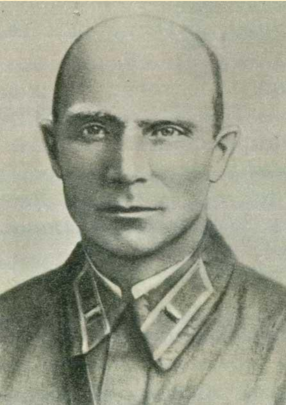
Капитан И.Н.Зубачёв. 30 июня 1941 года раненым взят в плен в развалинах штабного каземата. Умер от туберкулеза в лагере Хаммельбург 1944 году.