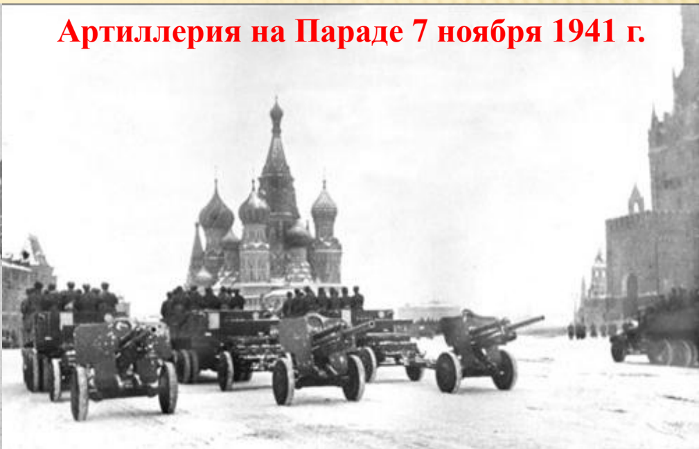
Артиллерия на Параде 7 ноября 1941 г.