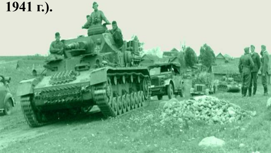
Немецкие танки на марше (сентябрь 1941 г.).