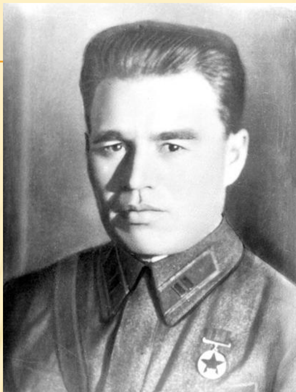
Майор П. М. Гаврилов. 23 июля 1941 года тяжело раненым в бою попадает в плен. Содержался в лагерях Хаммельбург и Равенсбрюк до мая 1945 года. В 1957 году получил звание Героя Советского Союза.