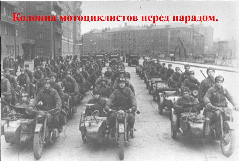
Колонна мотоциклистов перед парадом.