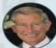
Принц Уэльский Чарльз (1948 г.р.)

Старший сын, наследник престола. Он станет королем Карлом III