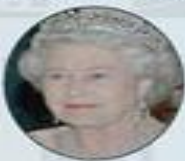
Королева Елизавета II и герцог Эдинбургский Филипп

Старший сын, наследник престола. Он станет королем Карлом III