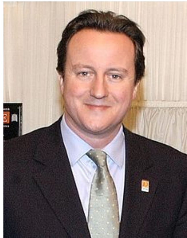
Дэвид Кэмерон, 2010 -

5 октября 2010 года Кэмерон извинился перед своими избирателями за то, что не смог полностью выполнить своё предвыборное обещание по выплате пособий по уходу за детьми — пособий будут лишены около 1,2 миллиона человек с высоким доходом.