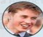
Принц Уильям (1982 г.р.)