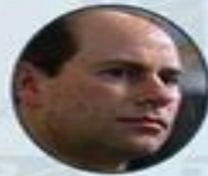
Принц Эдвард, граф Уэссекский (Эдвард Энтони Ричард Луис) (1964 г.р.)

В линии наследования Британского трона является 7-м