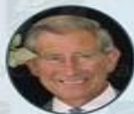
Принц Уэльский Чарльз (1948 г.р.)

Старший сын, наследник престола. Он станет королем Карлом III