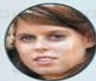
Принцесса Беатрис (1988 г.р.)