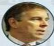
Герцог Йоркский Эдвард (1960 г.р.)

Занимает 4-е место в линии наследования Британского трона