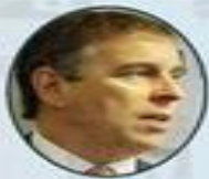
Герцог Йоркский Эдвард (1960 г.р.)

Занимает 4-е место в линии наследования Британского трона