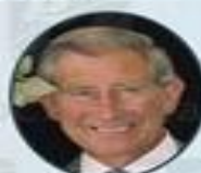
Принц Уэльский Чарльз (1948 г.р.)

Старший сын, наследник престола. Он станет королем Карлом III