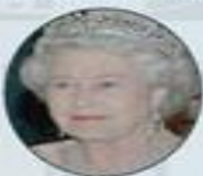
Королева Елизавета II и герцог Эдинбургский Филипп

Старший сын, наследник престола. Он станет королем Карлом III