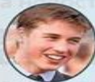
Принц Уильям (1982 г.р.)