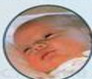
Луиза Маунтбэттан-Виндзор (2003 г.р.)

17 декабря у Эдварда и Софи родился сын — уже известно, что он будет носить титул виконта Северна и станет восьмым в линии престолонаследия