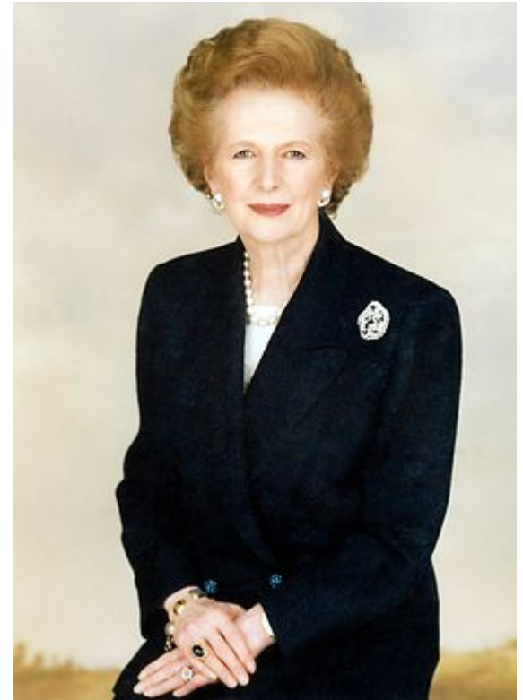
Маргарет Тэтчер – «железная леди», премьер – министр с 1979 – 1990г.