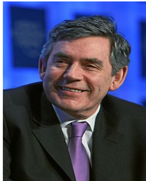
Гордон Браун, 1997 -2010