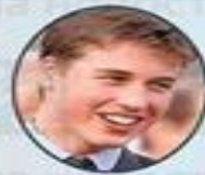
Принц Уильям (1982 г.р.)