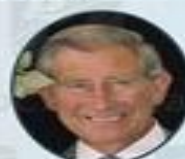
Принц Уэльский Чарльз (1948 г.р.)

Старший сын, наследник престола. Он станет королем Карлом III