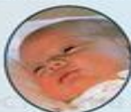
Луиза Маунтбаттен-Виндзор (2003 г.р.)

17 декабря у Эдварда и Софи родился сын — уже известно, что он будет носить титул виконта Северна и станет восьмым в линии престолонаследия