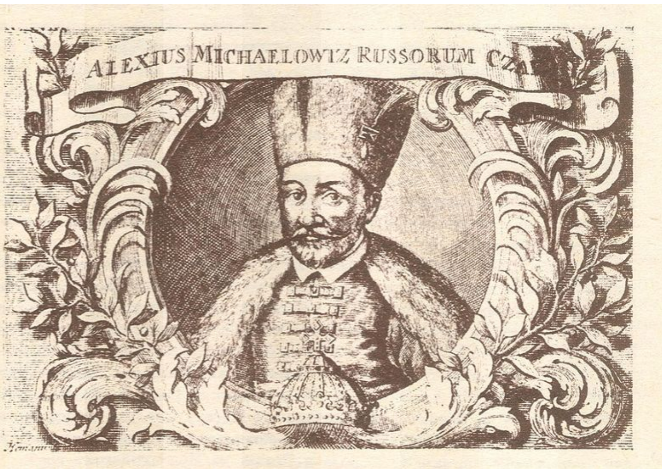
Царь Алексей Михайлович. Гравюра XVII века. Редкое изображение государя в повседневной одежде

В правление Алексея Михайловича усилилась центральная власть и оформилось крепостное право (Соборное уложение 1649); воссоединена с Русским государством Украина (1654), возвращены Смоленск, Северская земля и др.; подавлены восстания в Москве, Новгороде, Пскове (1648, 1650, 1662) и Крестьянская война 1670-71; произошел раскол русской церкви.