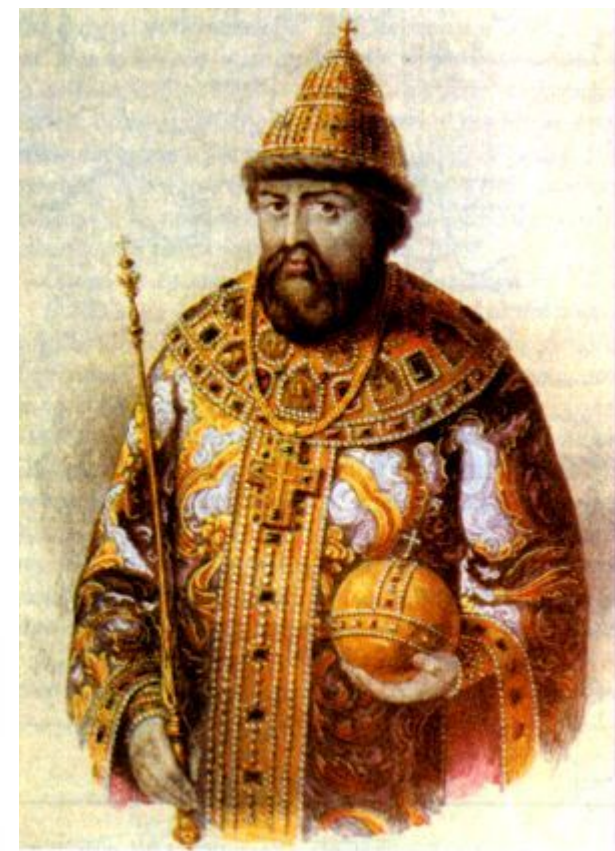
Царь Алексей Михайлович

Алексей Михайлович непосредственно участвовал во многих военных походах (под Смоленск, Вильно, Ригу), руководил внешнеполитическими переговорами со шведами, поляками и др., усилил контроль за деятельностью русских послов и т. д. Для своего времени он был образованным человеком.