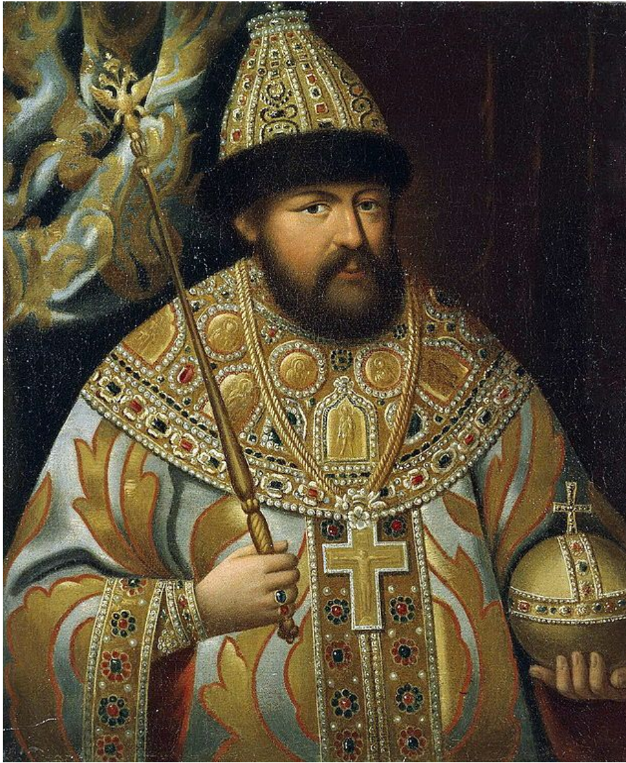
Портрет царя Алексея Михайловича. Неизвестный русский художник второй половины 17 века. Школа Оружейной палаты. Конец 1670 - начало 1680 годов

Царя Алексея Михайловича окрестили Тишайшим. Но по сути он был никак не тихоней, а человеком с богатейшей фантазией, оставившим большой след в российской истории и культуре