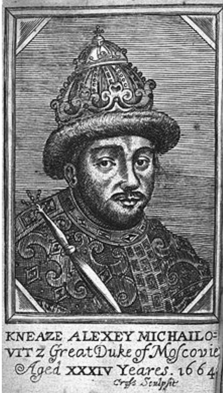
Алексей Михайлович (польская гравюра, 1664 год)

Затягивание Москвой решения по просьбам малороссийского казачества и православной шляхты о присоединении Малороссии к России, привело к тому, что Богдан Хмельницкий сделал соответствующее предложение турецкому султану Махмеду IV, который скоро ответил согласием.