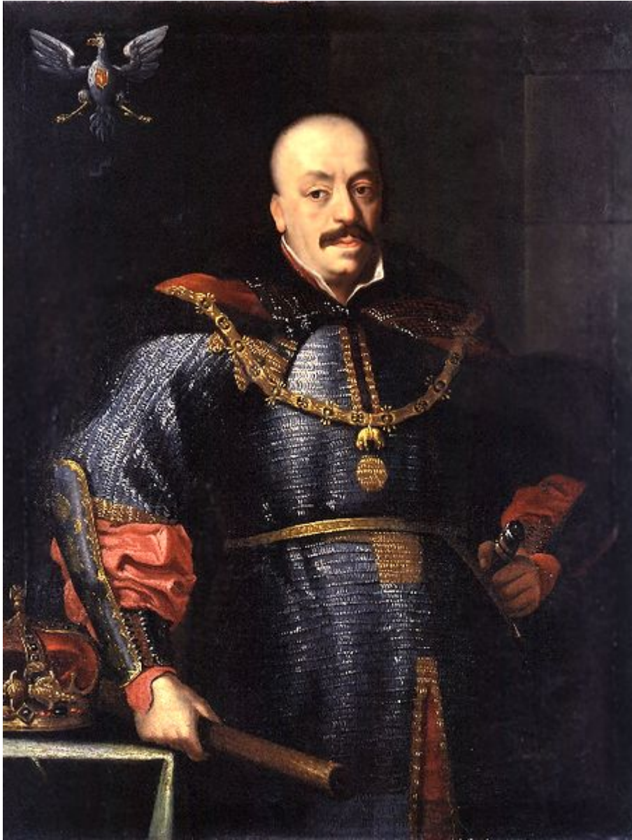
Король Польши Ян II Казимир Ваза