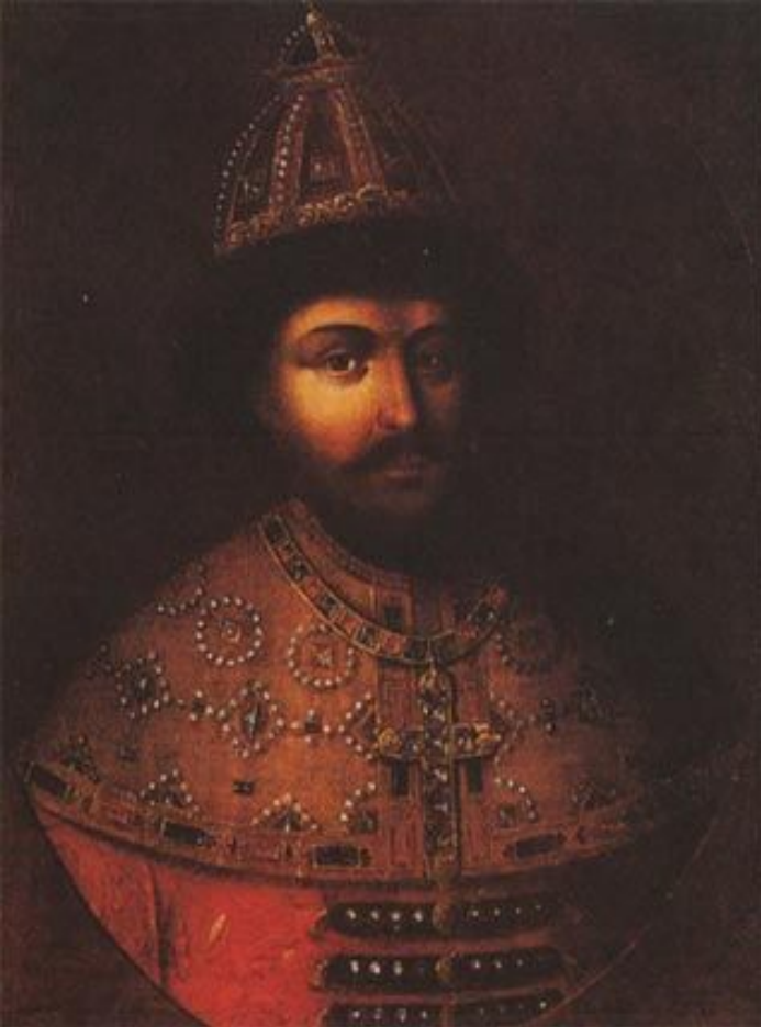
Портрет царя Алексея Михайловича. Неизвестный художник. Копия первой половины XVIII века с парусины XVII века.