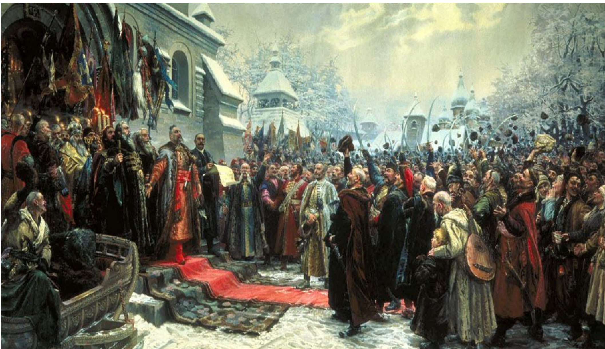
Навеки с русским народом. Переяславская рада. 8 января 1654 г., (Михаил Хмелько)

8 января 1654 г. в г. Переяславе Украинская рада в лице представителей Запорожского войска, Киевского, Брацлавского, Черниговского воеводств и 5 казацких полков объявили о своем переходе вместе "с городами и землями" в российское подданство.