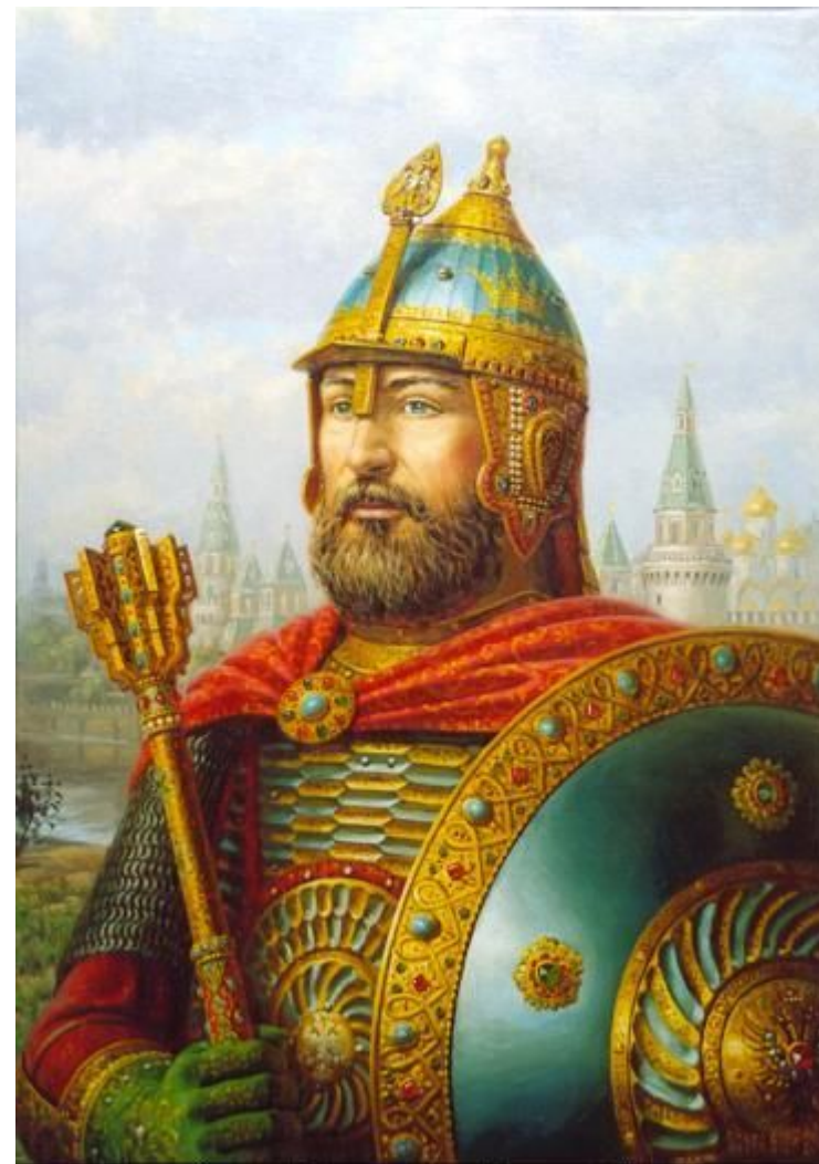
"Царь Алексей Михайлович Романов".

Юридически его присоединение закрепило Андрусовское перемирие 1667 г. и подтвердил Вечный мир 1686 г. между Россией и Речью Посполитой.