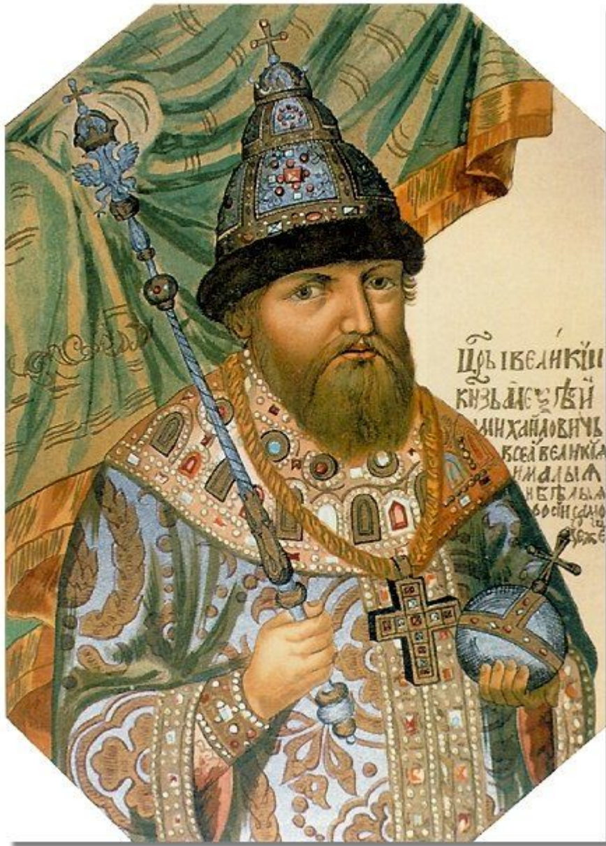
Царь Алексей Михайлович Миниатюра из Титулярника 1672 г.

Внешняя политика Алексея Михайловича ознаменовалась практически непрерывными войнами. Границы государства расширились за счет земель Дальнего Востока и Восточной Сибири.