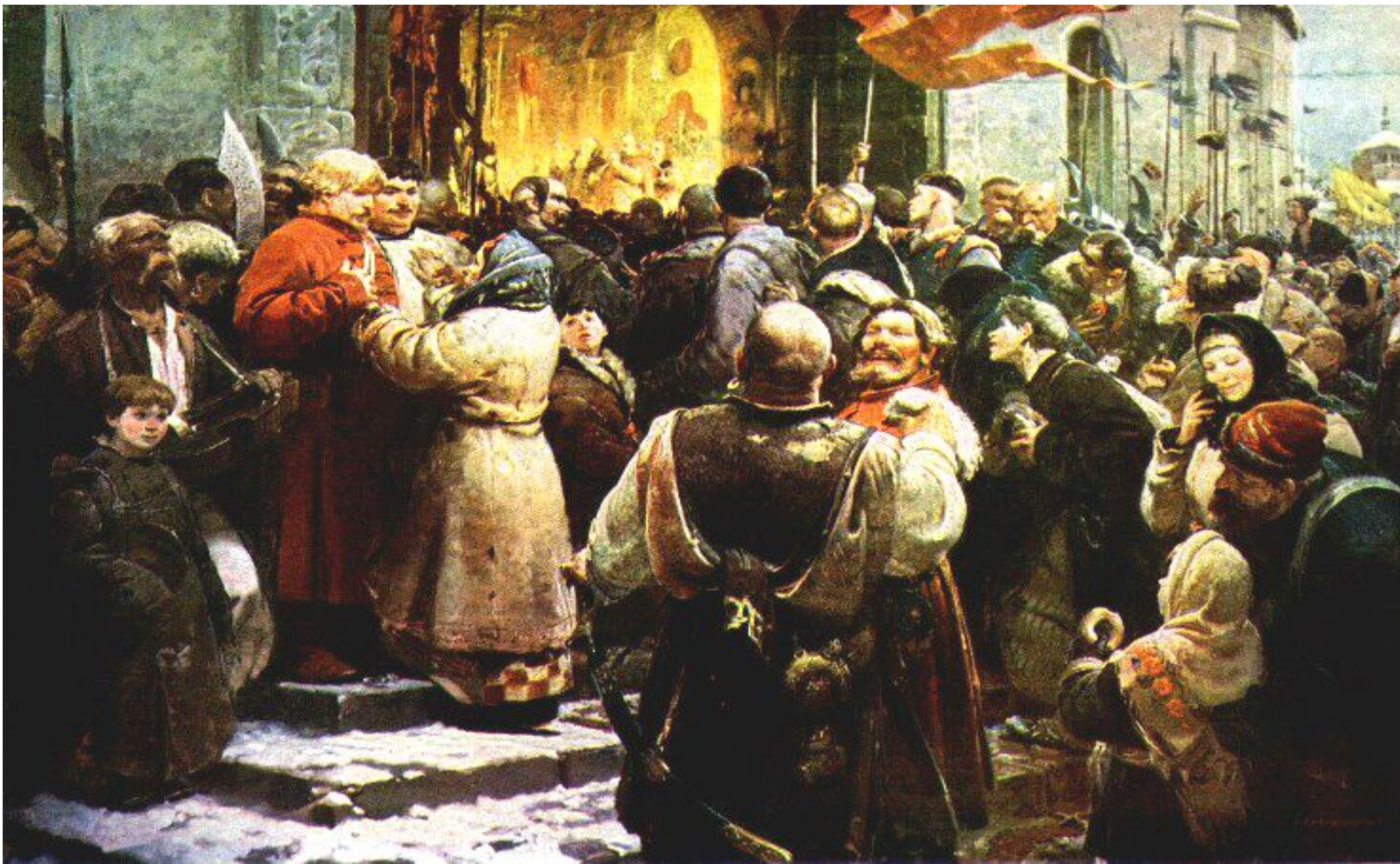
Навеки вместе, (А. Хмельницкий)