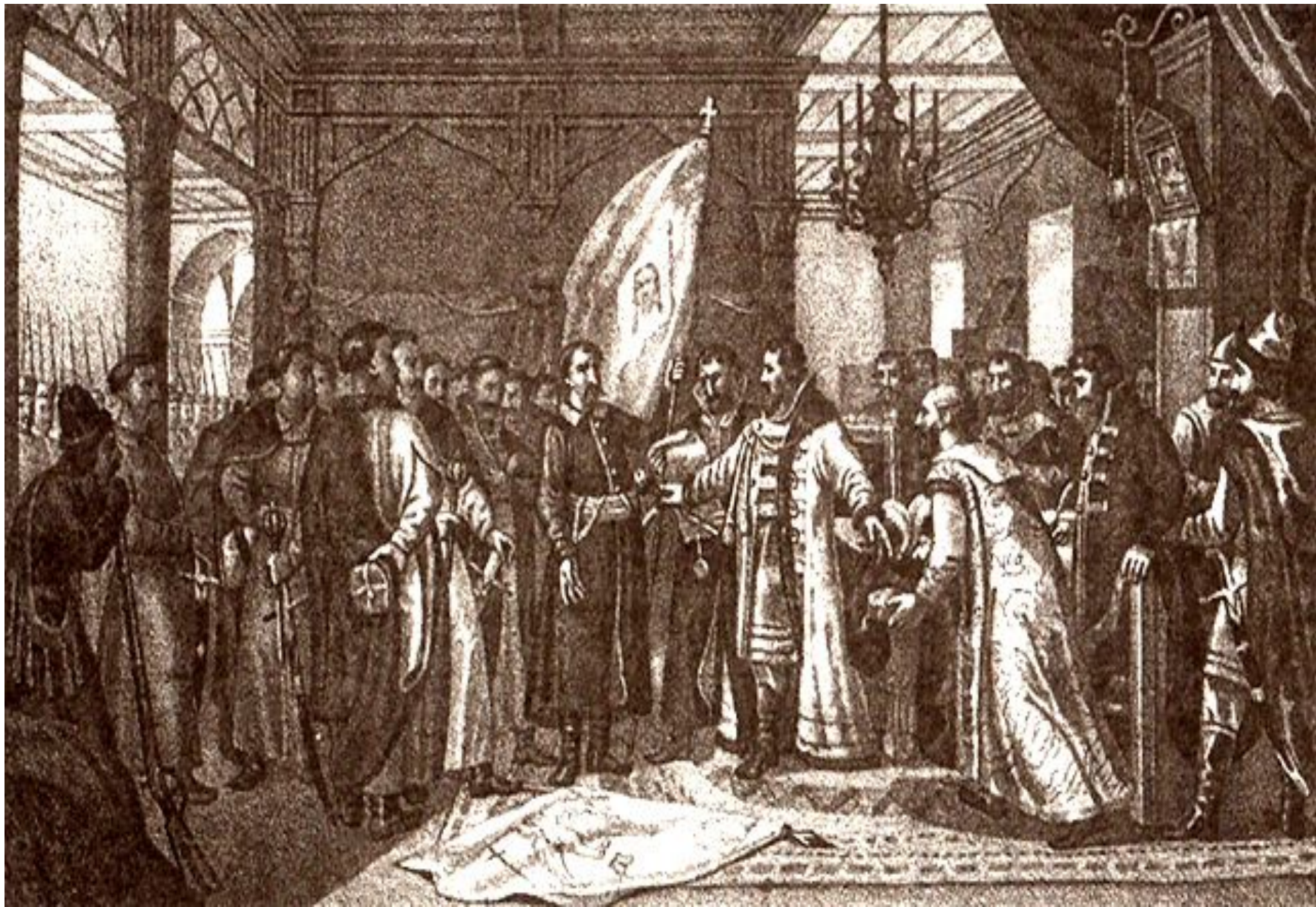
Богдан Хмельницкий приводит Малороссию в подданство России, (Борис Чориков)