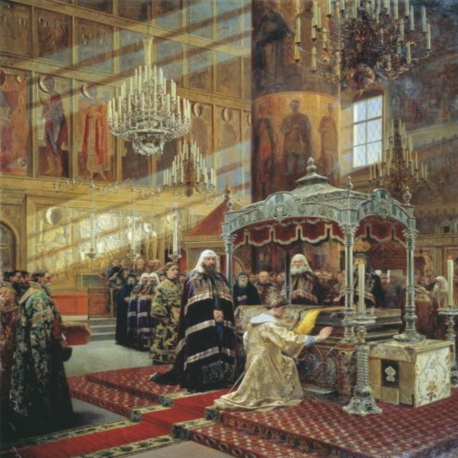
«Царь Алексей Михайлович и Никон, архиепископ Новгородский, у гроба чудотворца Филлиппа, митрополита Московского» 1886, Литовченко А.Д.. Холст, масло 225 x 183,8 Государственная Третьяковская галерея Москва