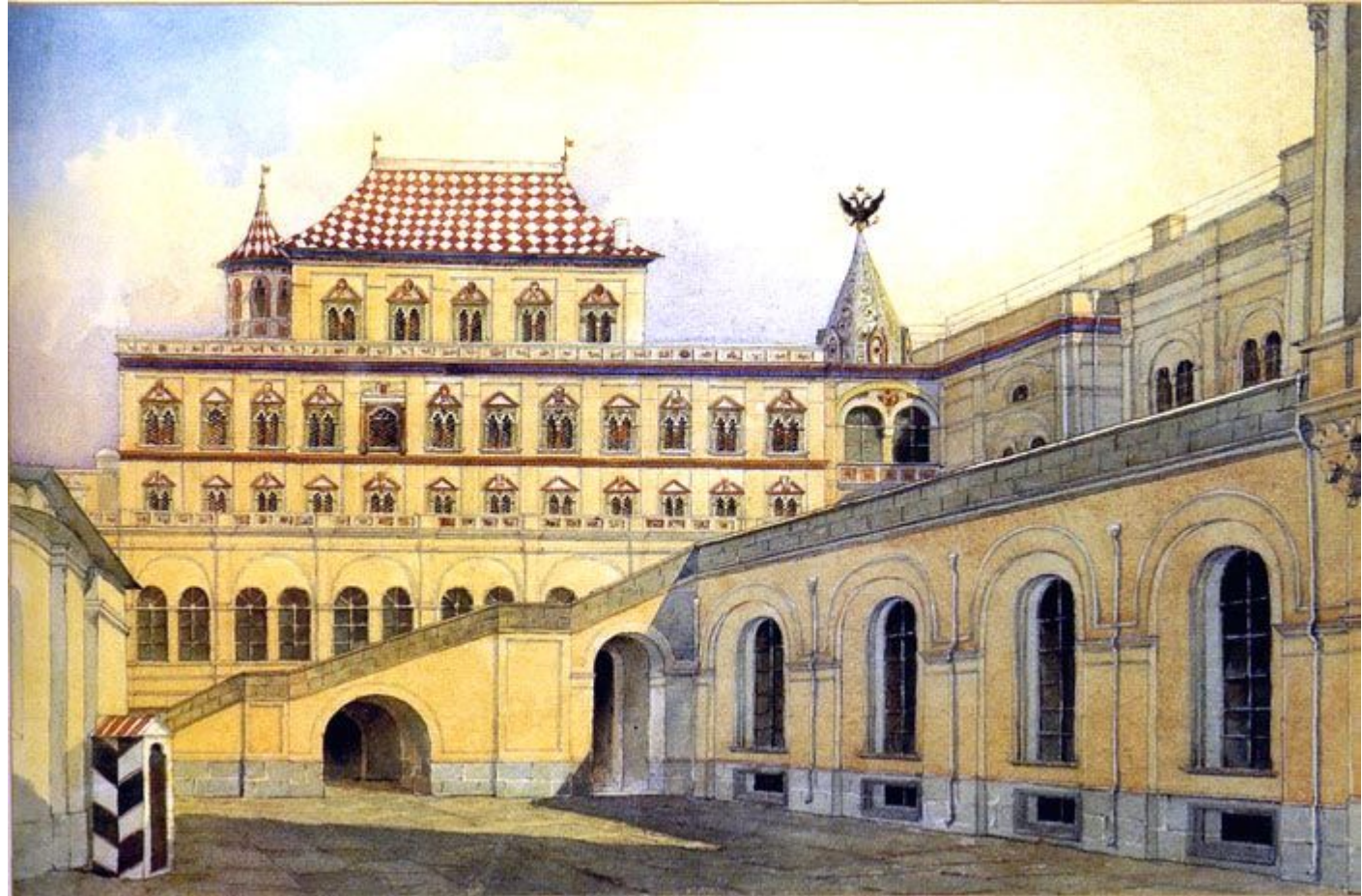
Терем царя Алексея Михайловича, (Карл Рабус)

Созданный царем Приказ тайных дел (1654—76) подчинялся непосредственно царю и осуществлял контроль над государственным управлением.