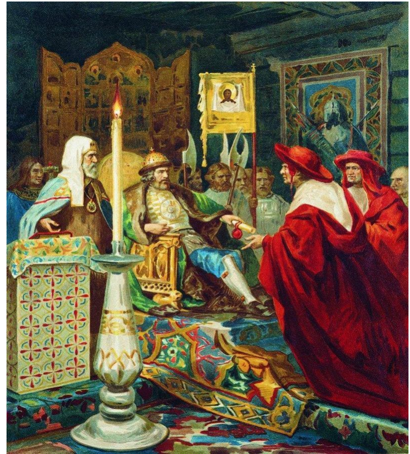
Худ. Г. Семирадский. Александр Невский принимает папских легатов