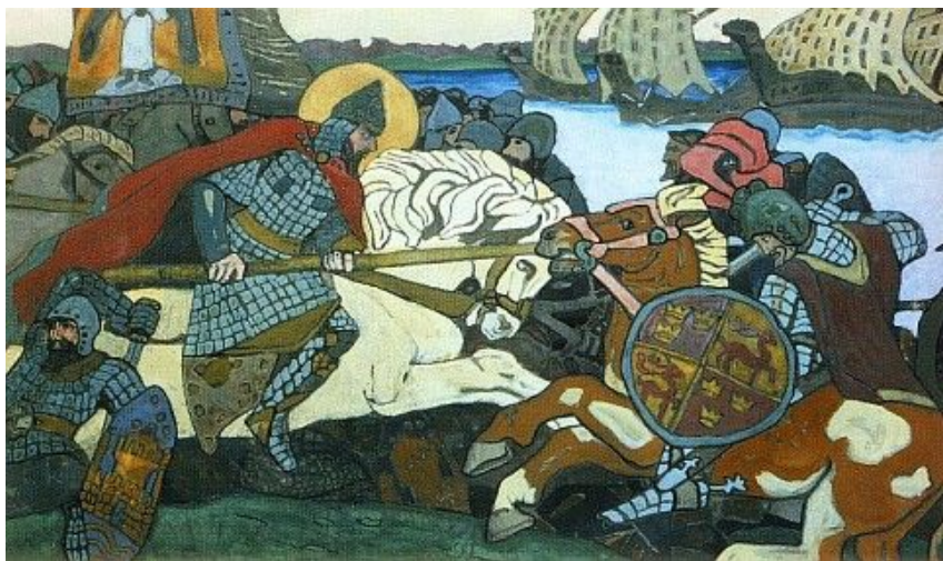
Худ. Н.К. Рерих. Бой Александра Невского со шведами