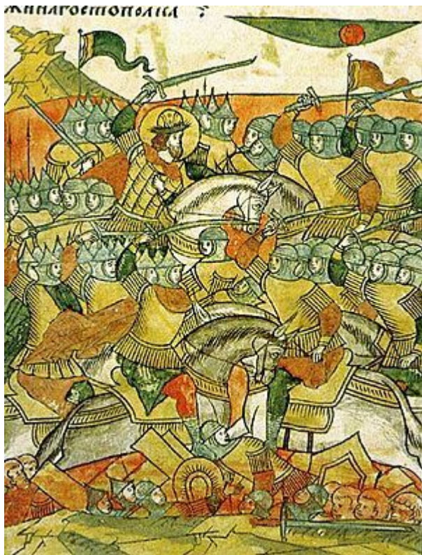
Ледовое побоище. Средневековая миниатюра из «Лицевого свода»