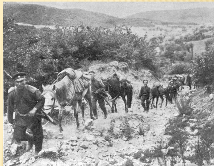
Рекогносцировка близъ деревни Ланафанъ.