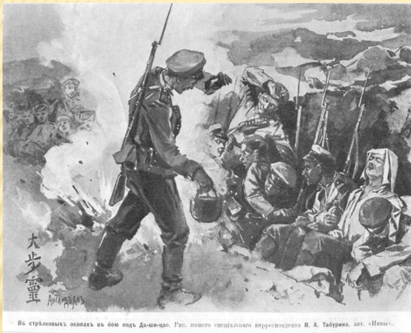
Въ стрѣлковыхъ окопахъ въ бою подъ Да-ши-цао. Рис. нашего спеціального корреспондента В. А. Табурина, авт. «Нивы».