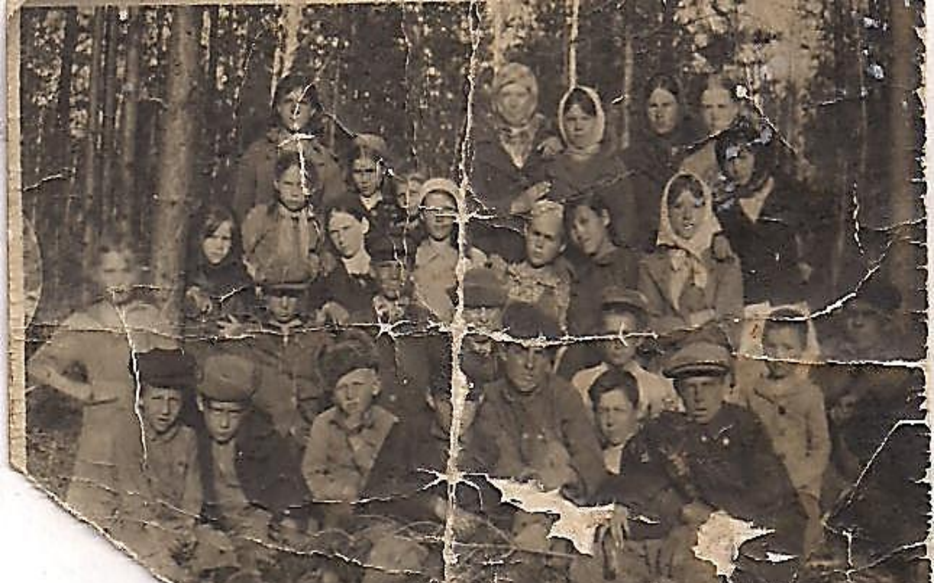
Дети деревни Халты в послевоенное время.