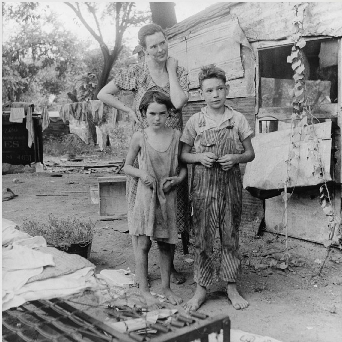
Мать и дети в период Великой депрессии. Доротея Ланж. 1936