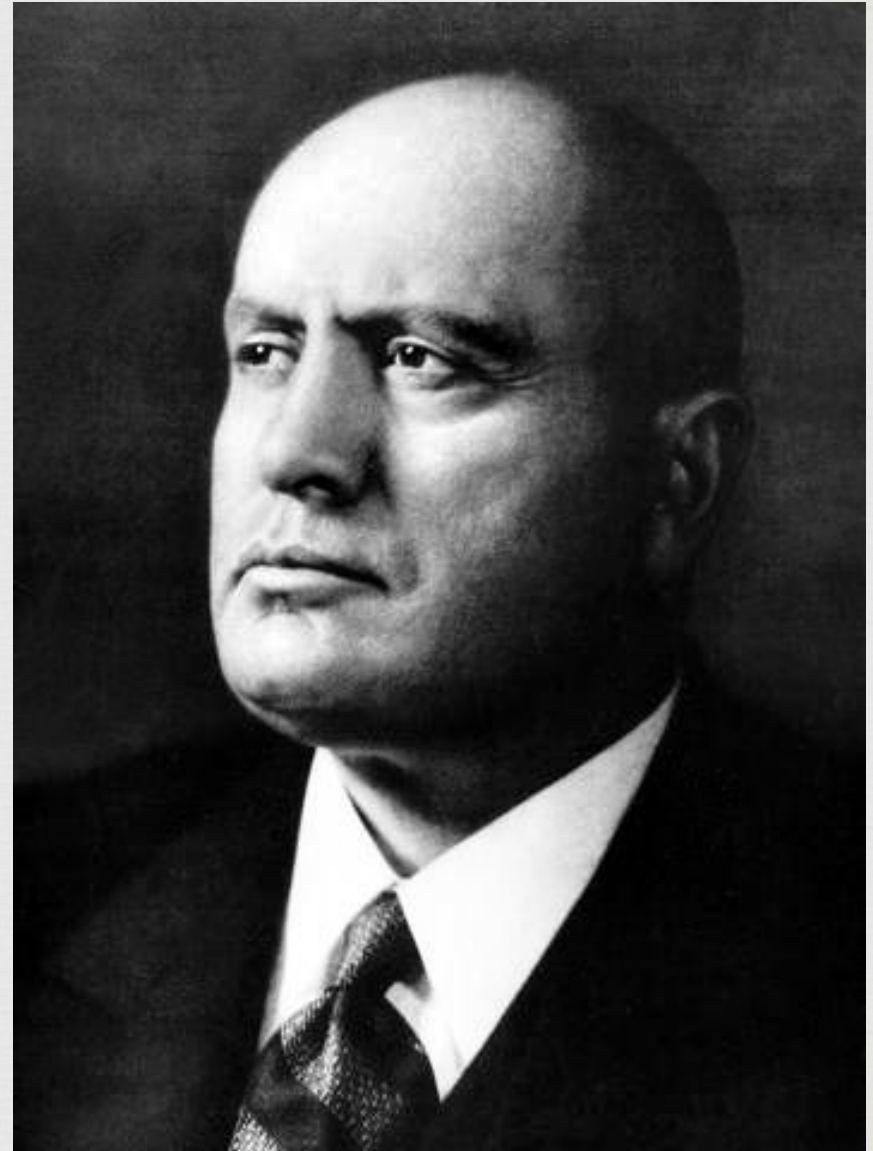
Бенито Муссолини - вождь («дуче»), возглавлявший Италию как премьер-министр в 1922 – 1943 годах.