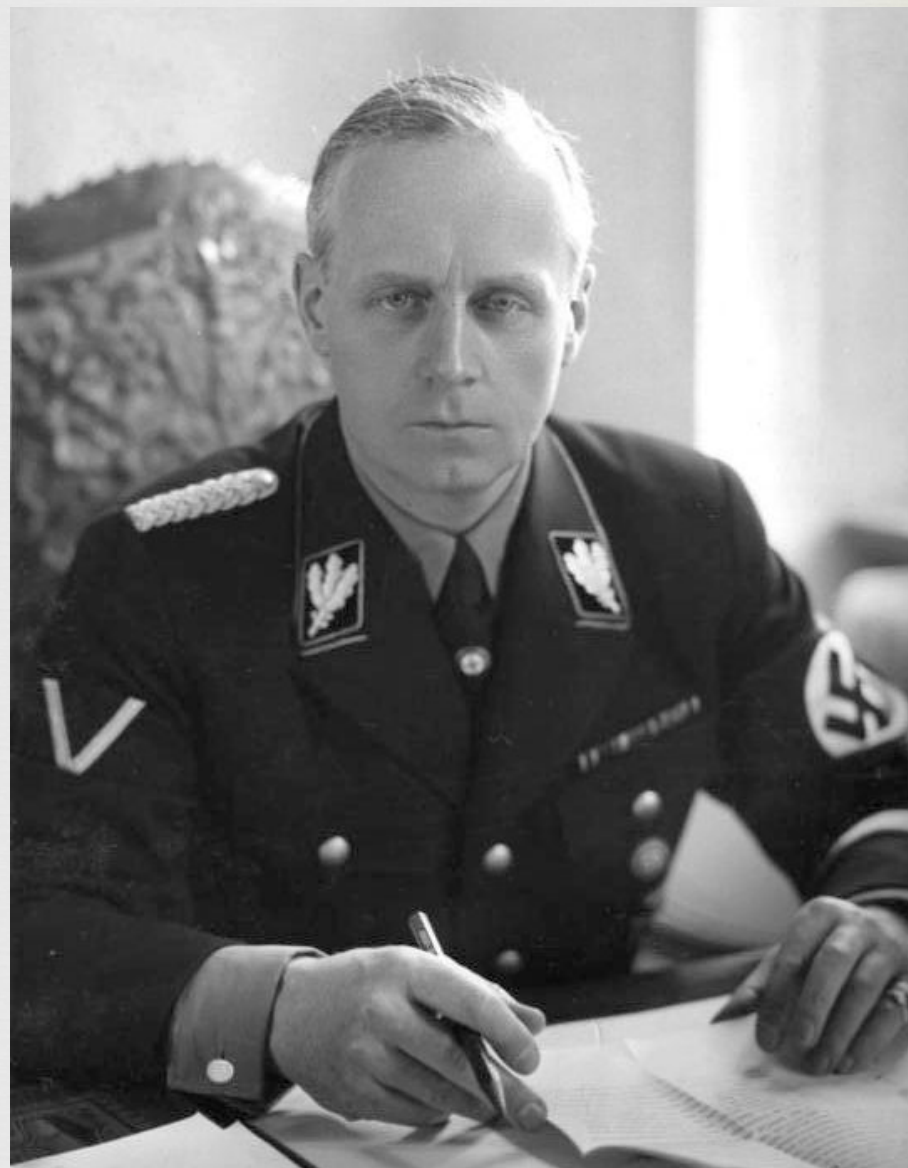
Иоахим фон Риббентроп. Глава немецкой делегации, направленной в Лондон для переговоров по англо-германскому военно-морскому соглашению.

□ Соглашение предусматривало признание права Германии иметь флот, тоннаж которого будет составлять 35 процентов британского. Временно Германия обязывалась сохранять свой подводный