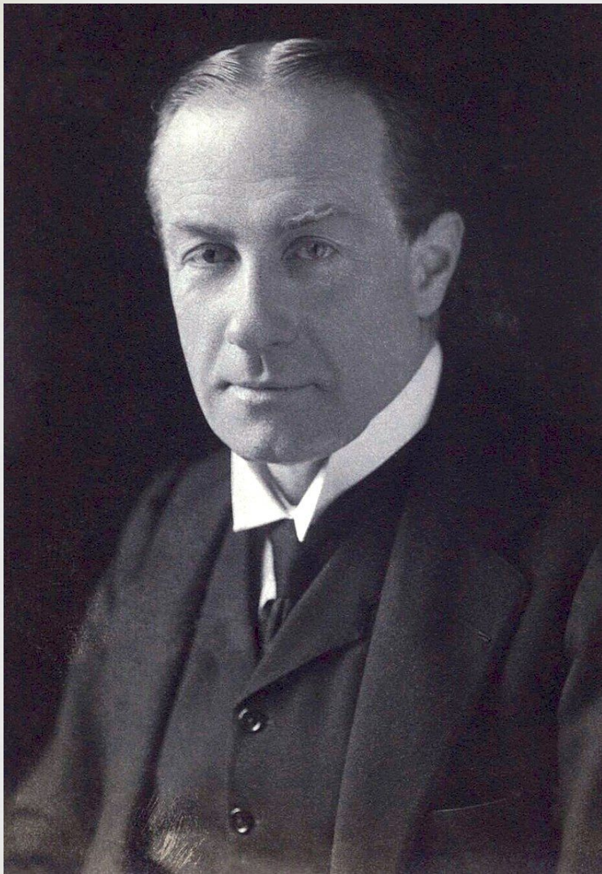
Стэнли Болдуин - министр иностранных дел Великобритании, Сторонник политики "равноудаленности" от взаимно противостоящих материковых держав