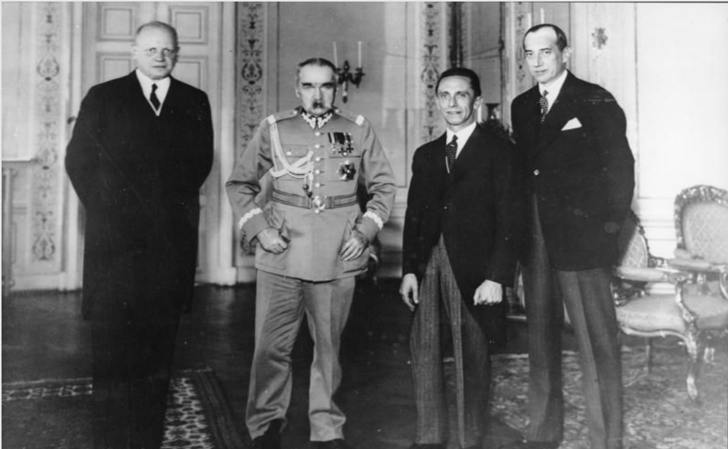
Германский посол Ганс-Адольф фон Мольтке, лидер Польши Юзеф Пилсудский, германский министр пропаганды Йозеф Геббельс и министр иностранных дел Польши Юзеф Бек на встрече в Варшаве 15 июня 1934 г., через 5 месяцев после подписания Договора о ненападении между Германией и Польшей.