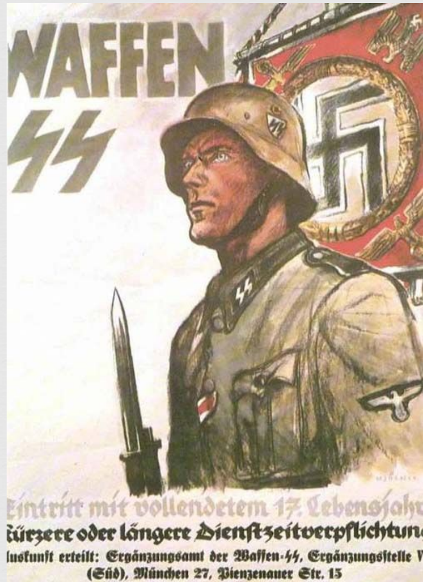
Ваффен СС, вступай с 17 лет .Агитационный плакат 1940 года. Пример проводимой в Третьем Рейхе агитации по вступлению молодёжи на службу