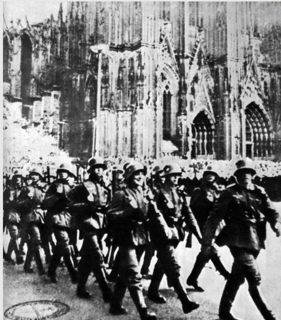
Занятие Рейнской демилитаризованной зоны. 7 марта 1936 г.