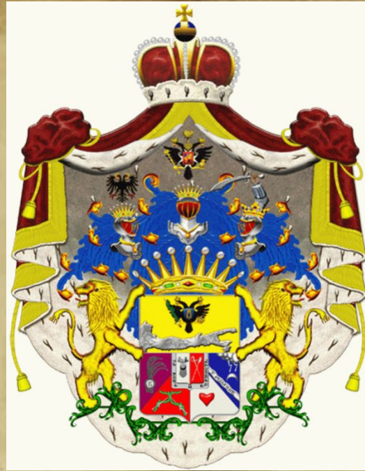
герб рода Суворовых- Рымникских князей Италийских