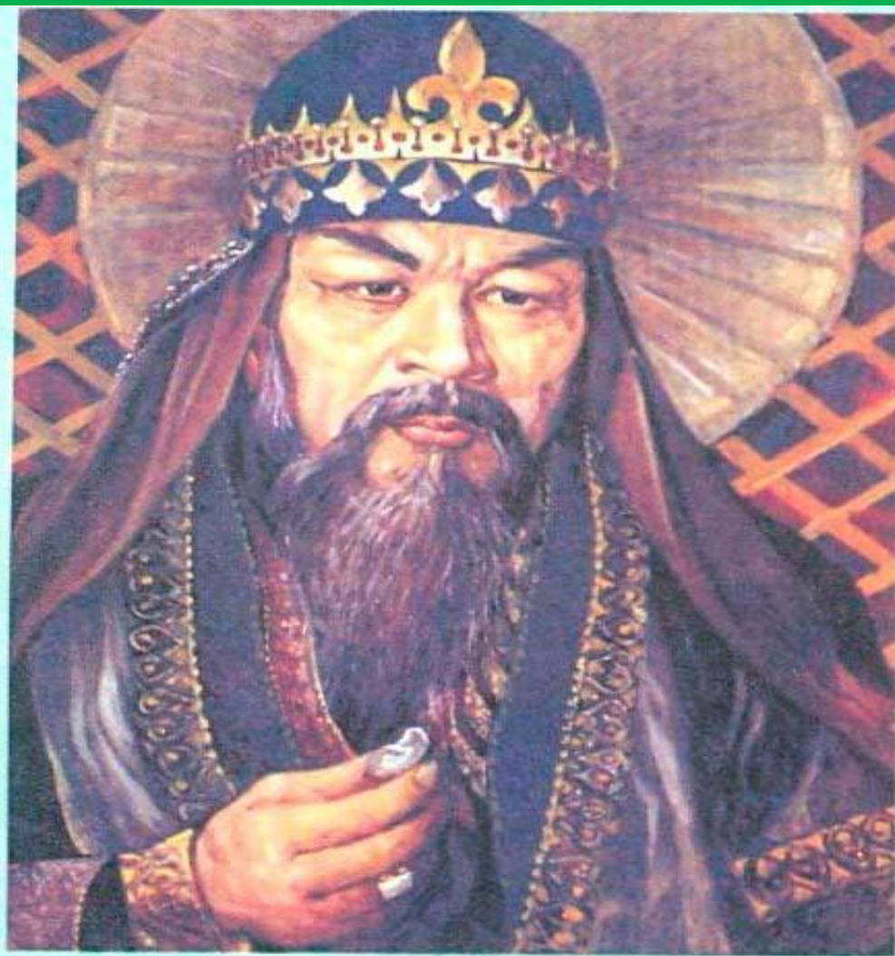
Жанибек-хан. Художник А.Бухар-баев