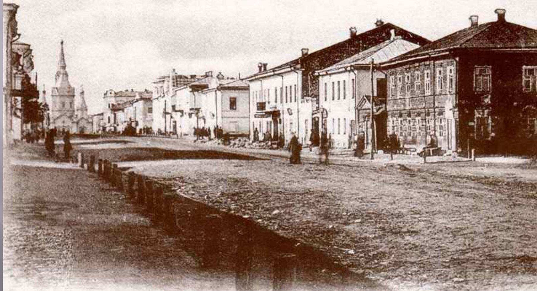
г. Касимовъ. № 8. Видъ на Соборную ул. отъ Ямской