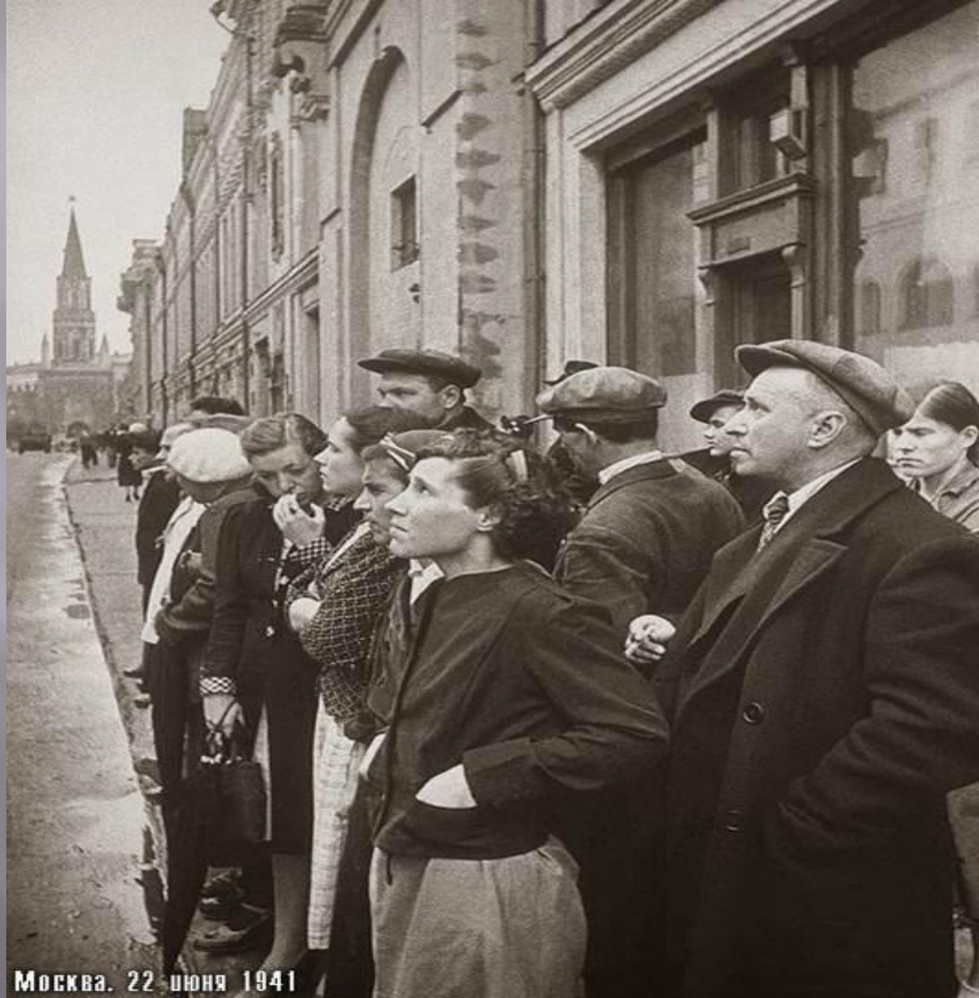
Москва. 22 июня 1941