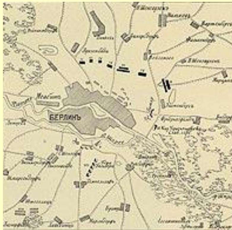
Взятие Берлина (1760)

22 сентября к ..... подошел конный русский отряд под командованием генерала Тотлебена. После недолгой артиллерийской подготовки Тотлебен в ночь на 23 сентября штурмовал столицу Пруссии . Взятие этого города имело для русских скорее финансовое, чем военное значение. Не менее важна была и символическая сторона данной операции. Это было первое в истории взятие этого города русскими войсками. Интересно, что в 20 веке перед решающим штурмом этого же города советские бойцы получили символический подарок - копии ключей от этого города, врученных немцами русским воинам в 1760 г.