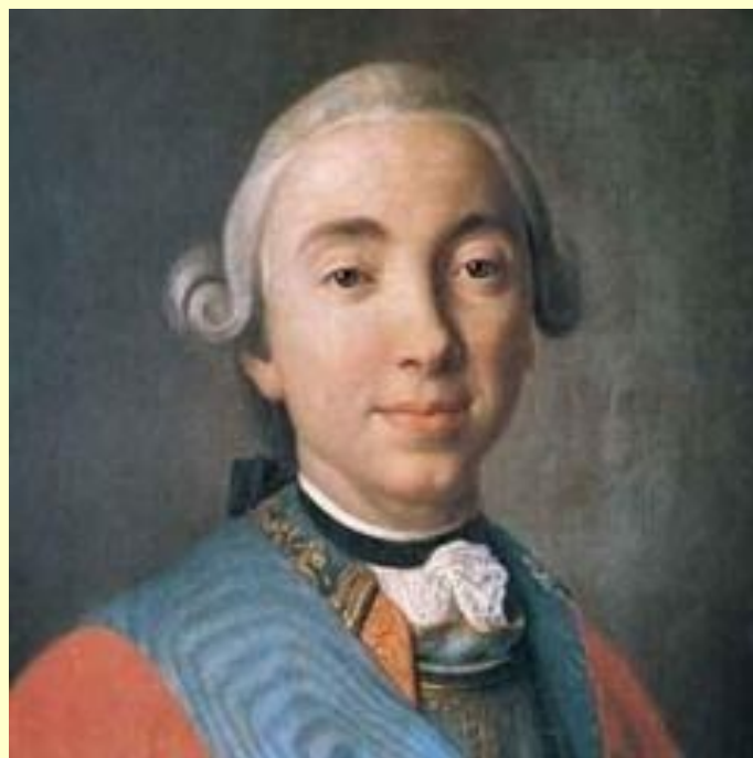
Петр III Федорович

К числу важнейших дел этого императора (императрицы) можно отнести: упразднение Тайной канцелярии, секуляризацию церковных земель, создания Госбанка, указ, по которому за убийство крепостных предусматривалась пожизненная ссылка. Издан Манифест о вольности дворянства. Прекратились военные действия против Пруссии.