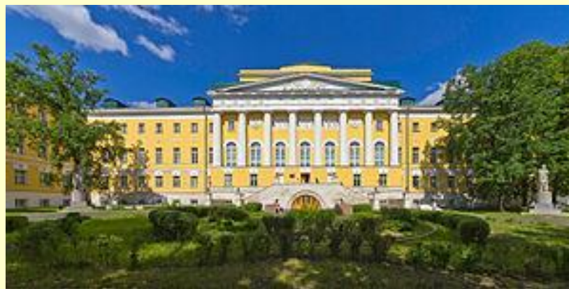
Здание МГУ на Моховой

Это день и год считается днем рождения Московского государственного университета. В этот день - день памяти святой мученицы Татианы - императрица Елизавета Петровна подписала Указ об основании Московского университета «для общей Отечеству славы», чтобы «возрастало в нашей пространной империи всякое полезное знание».