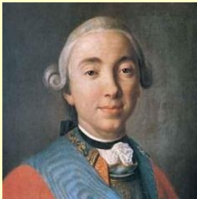
Петр III Федорович

К числу важнейших дел этого императора (императрицы) можно отнести: упразднение Тайной канцелярии, секуляризацию церковных земель, создания Госбанка, указ, по которому за убийство крепостных предусматривалась пожизненная ссылка. Издан Манифест о вольности дворянства. Прекратились военные действия против Пруссии.