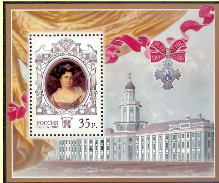
Екатерина I Алексеевна

В годы правления этого императора (императрицы) была открыта Академия наук, организована экспедиция В. Беринга, учреждён орден Святого Александра Невского.