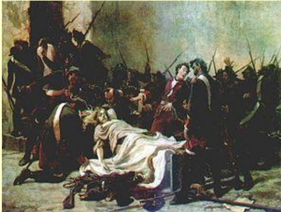
Мирович перед телом Ивана VI. Картина Ивана Творожникова (1884)

С 1756 года находился в Шлиссельбургской крепости. Был убит стражей при попытке офицера В.Я. Мировича освободить его и провозгласить императором вместо Екатерины II .