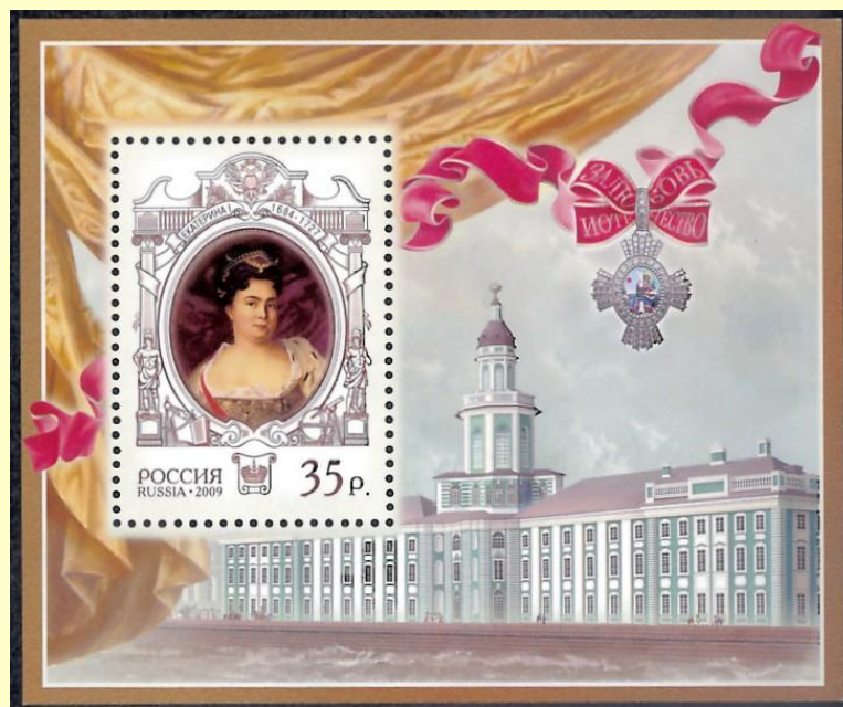
Екатерина I Алексеевна

В годы правления этого императора (императрицы) была открыта Академия наук, организована экспедиция В. Беринга, учреждён орден Святого Александра Невского.