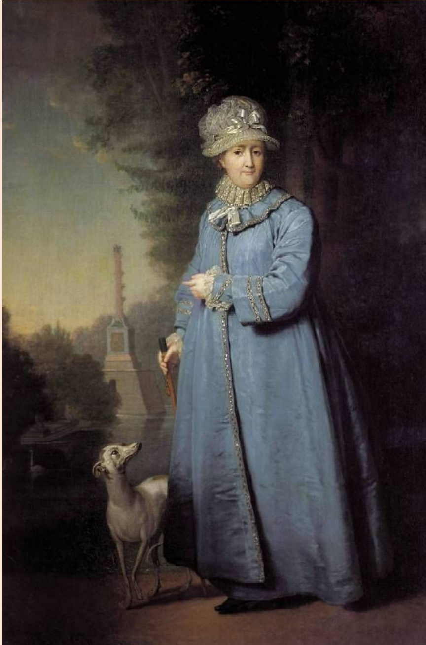
«Портрет Екатерины II»