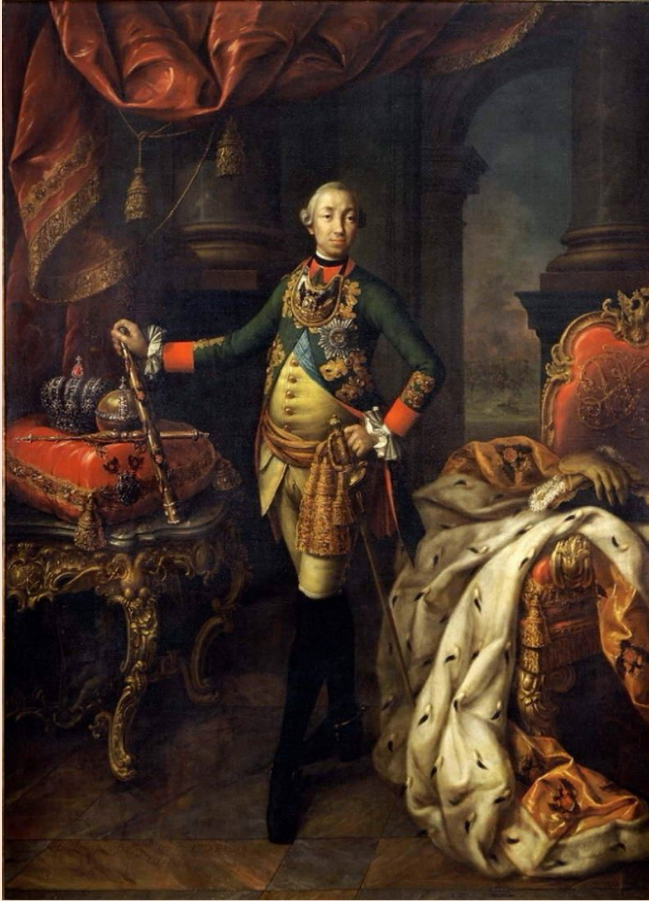
«Портрет Петра III»