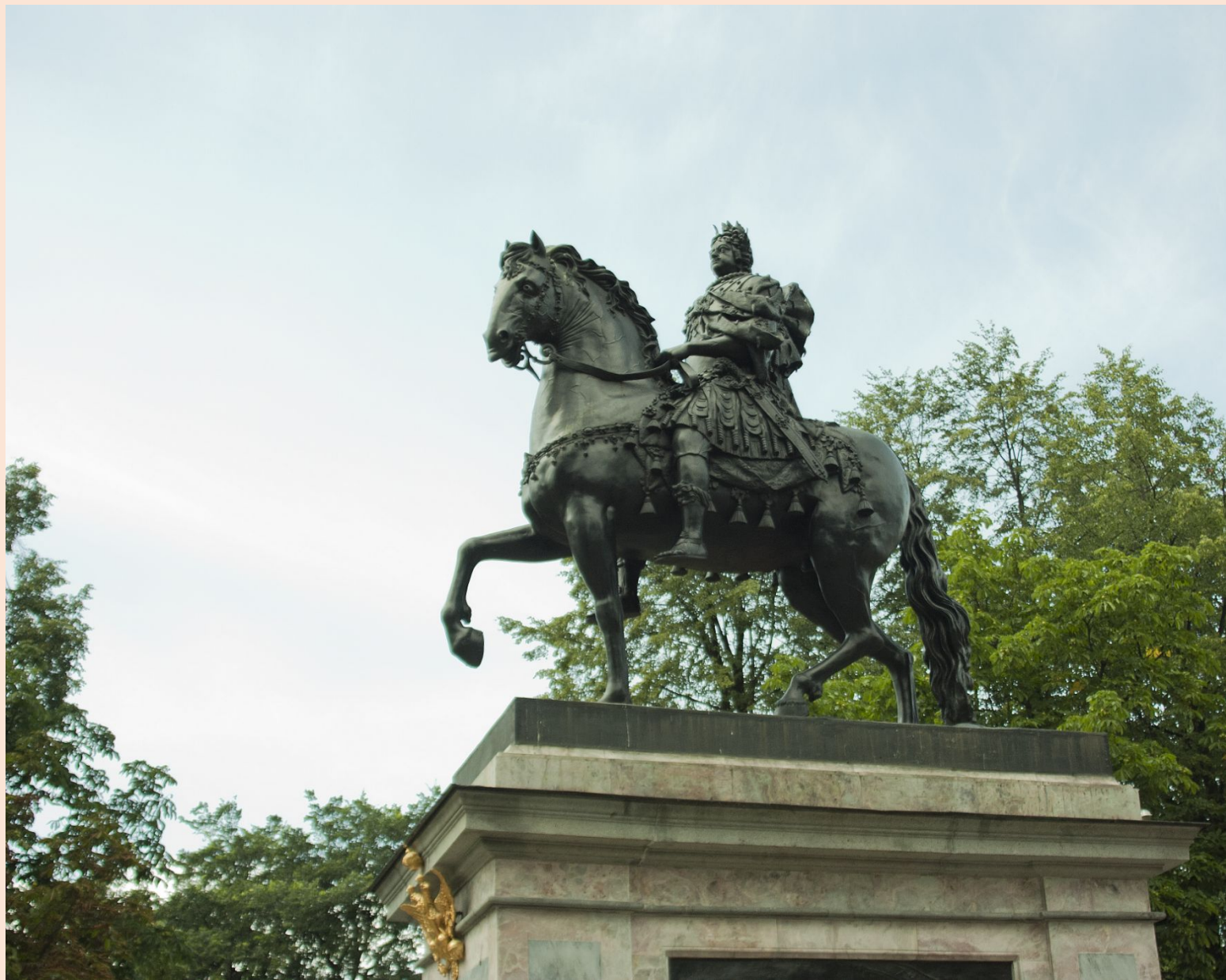
Б.К. Растрелли Памятник Петру I