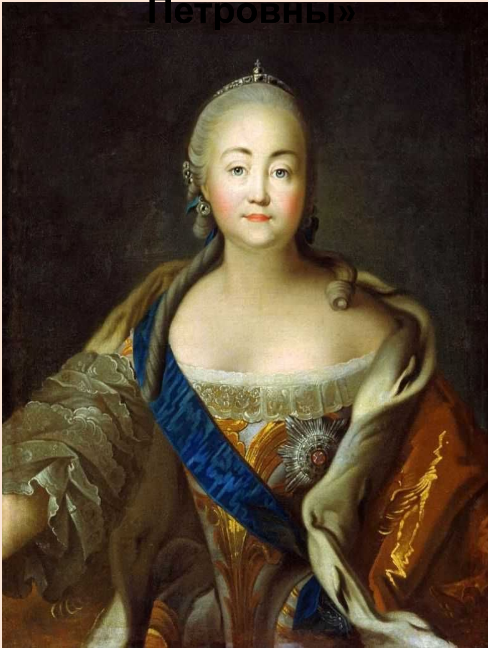
«Портрет Елизаветы Петровны»