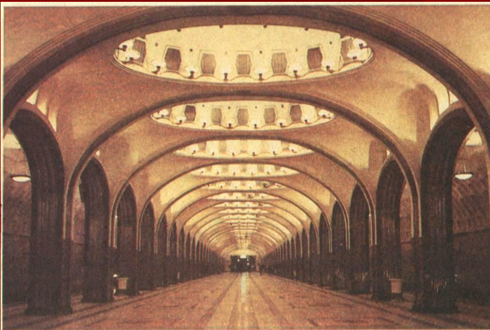
Станция «Маяковская» Московского метрополитена