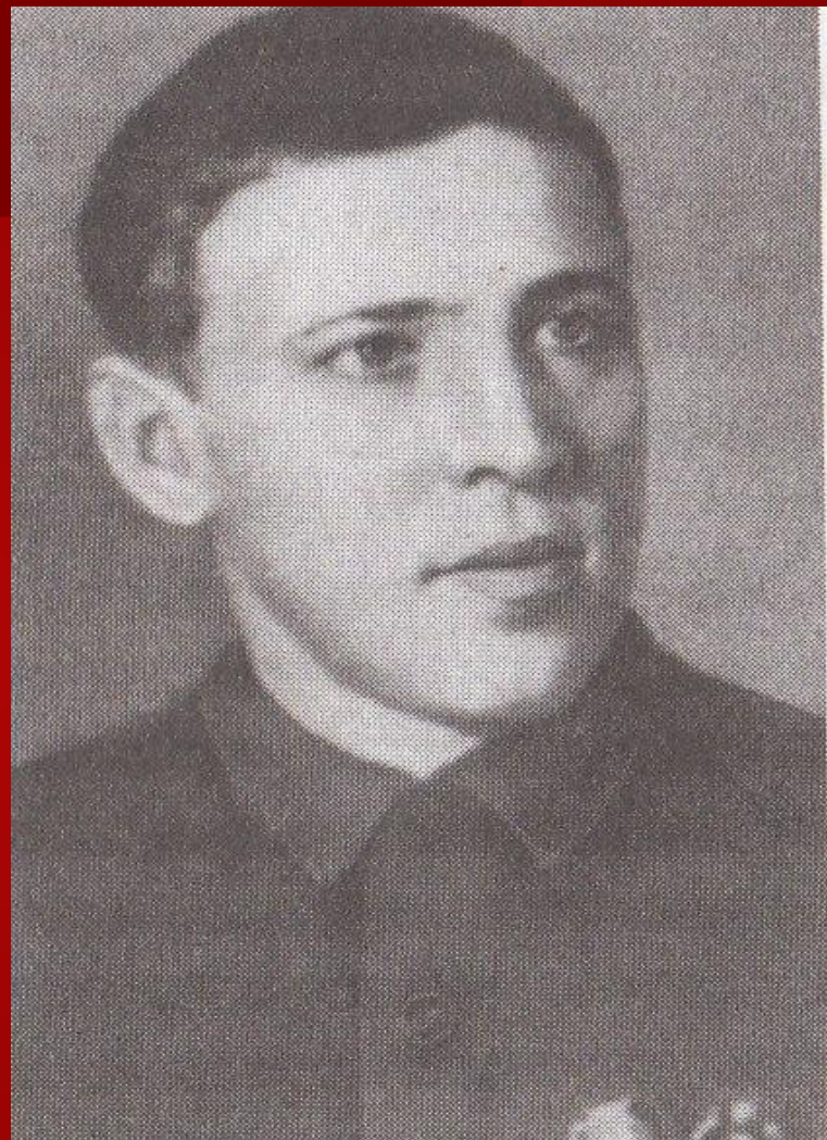
А. Г. Стаханов

В августе 1935 г. беспартийный горняк Алексей Стаханов вырубил за смену 102 т угля вместо 7 т по норме. Почин Стаханова подхватили другие шахтёры, он распространился во многих отраслях промышленности.