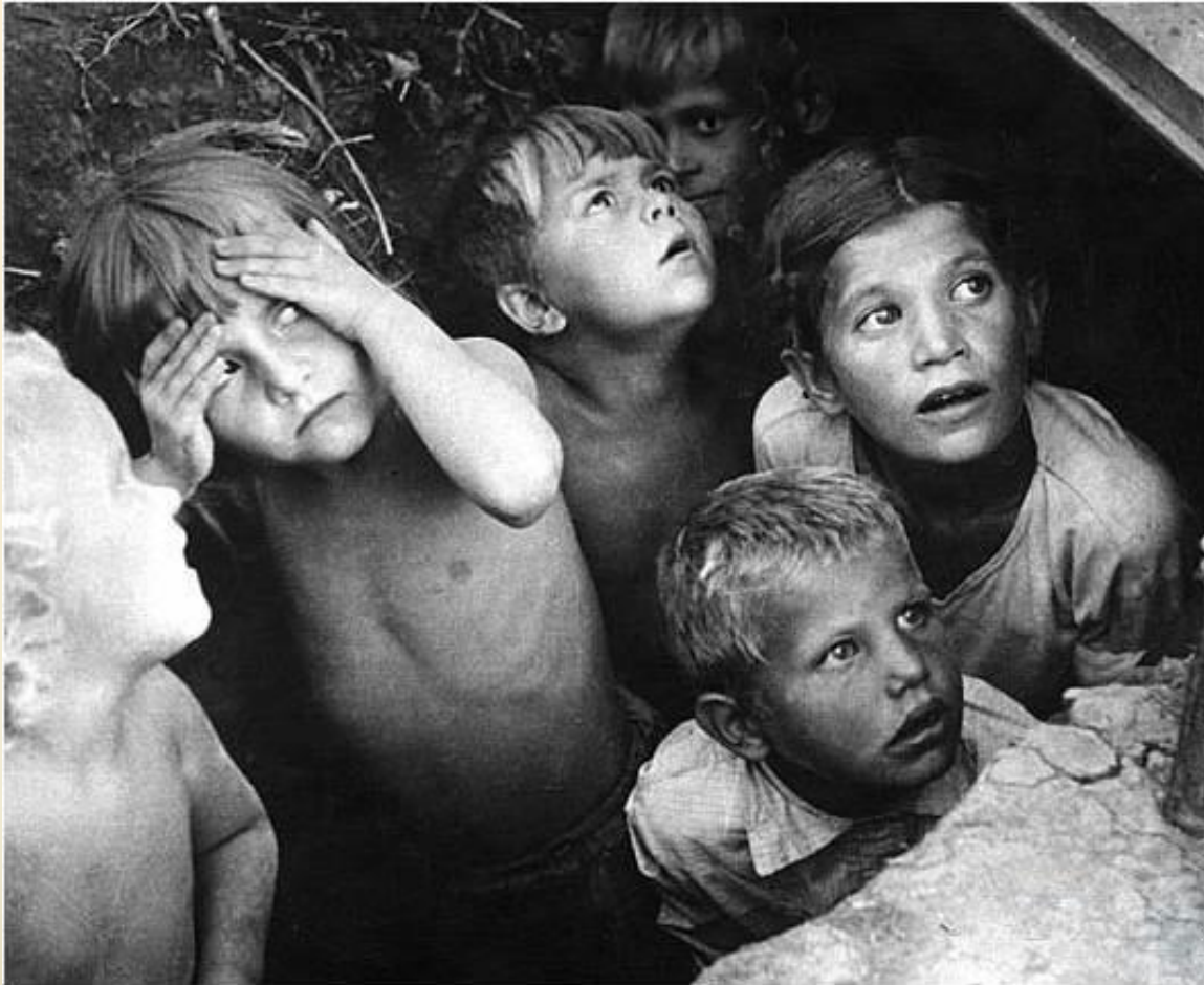
Снова бомбёжка. Сталинград, 1941 год.