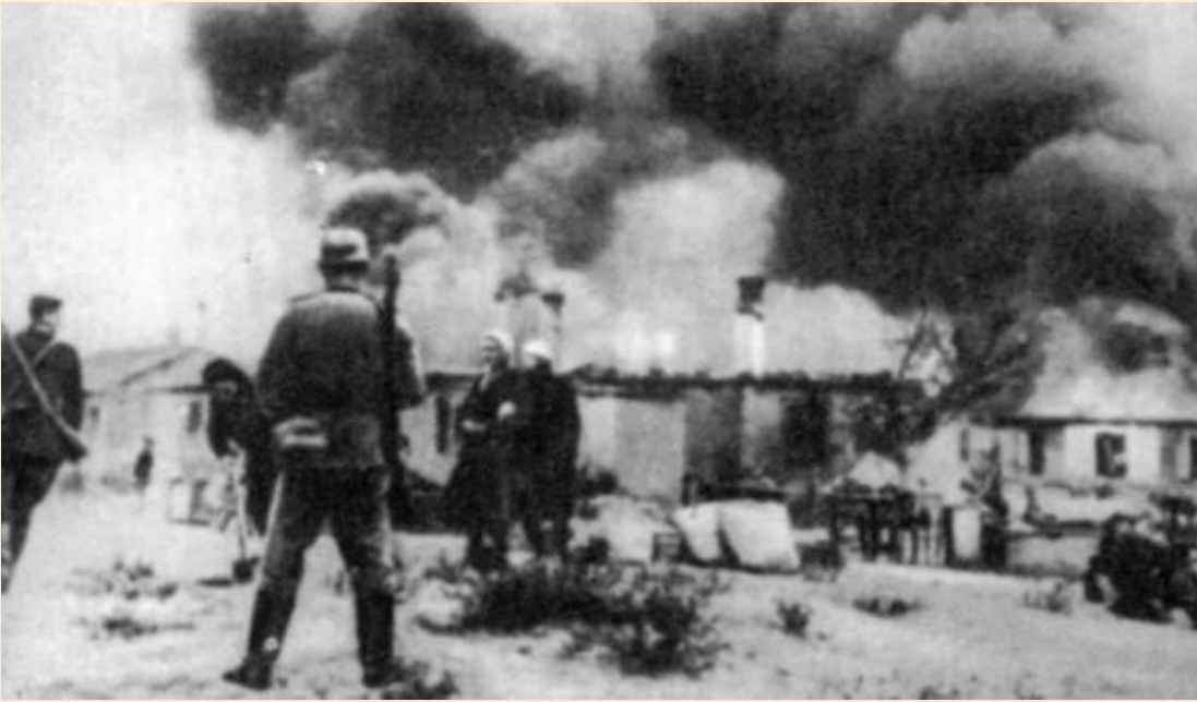
Отряд карателей сжигает деревню