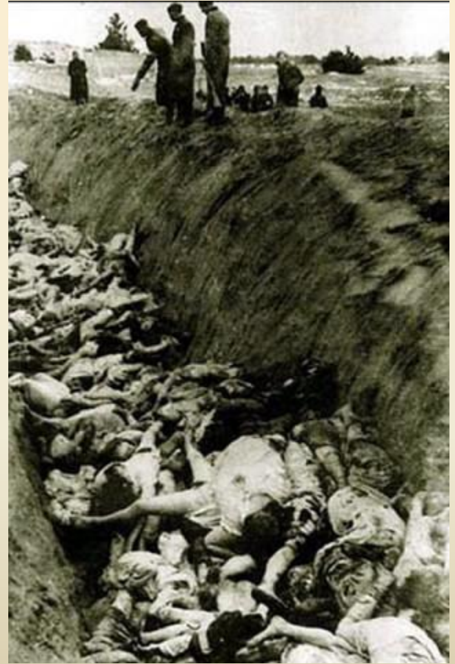
Расстрелянные немцами мирные жители в 1941 году