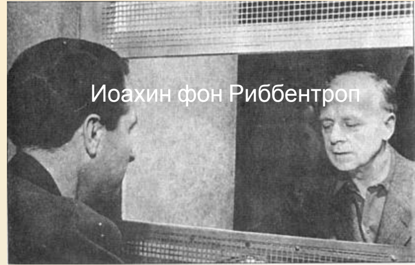
Иоахин фон Риббентроп