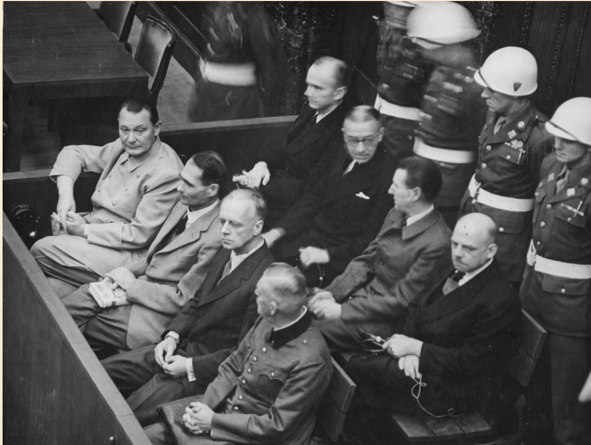
Нюрнбергский процесс - Международный трибунал.