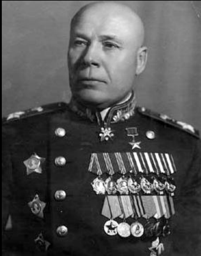
Семён Константинович Тимошенко— советский военачальник, Маршал Советского Союза(1940), дважды Герой Советского Союза (1940. 1965). Народный комиссар обороны СССР (май 1940 — июль 1941).