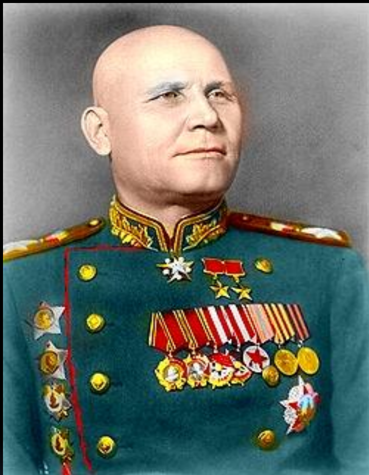
Иван Степанович Конев— советский полководец, Маршал Советского Союза (1944), дважды Герой Советского Союза (1944, 1945).