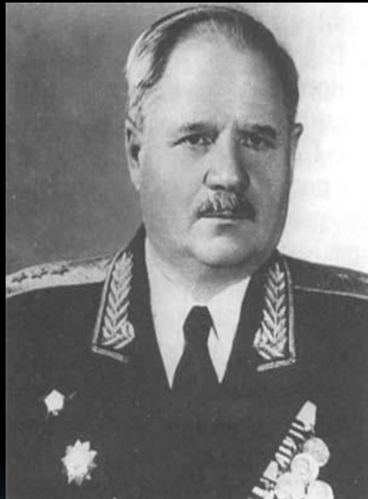
Иван Васильевич Болдин — советский военачальник, командарм Великой Отечественной войны, генерал-полковник (1944).