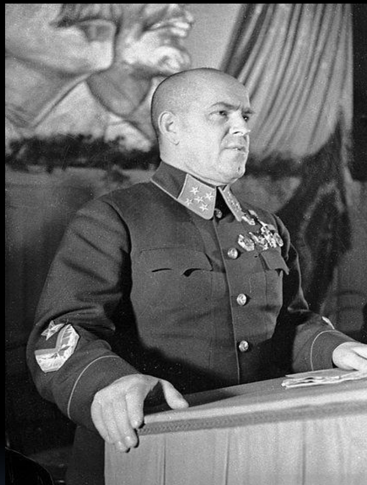
Георгий Константинович Жуков — советский военачальник. Маршал Советского Союза (1943), министр обороны СССР (1955—1957).