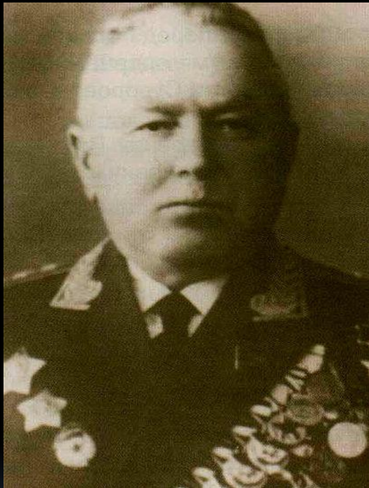
Кузнецов Василий Иванович советский военачальник, генерал-полковник (1943), Герой Советского Союза.