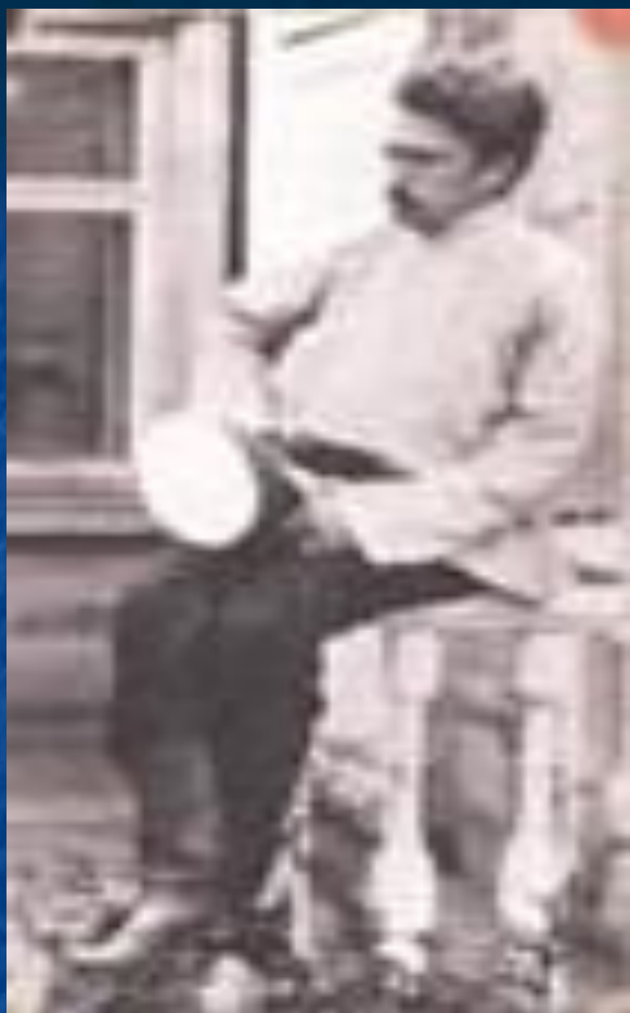
Соловьев С.М. 1820 – 1879 гг.