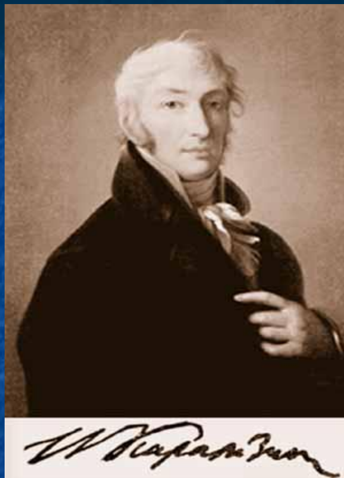
Карамзин Н.М. 1766 – 1826 гг.