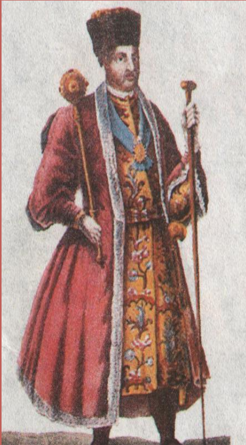
Атаман Донского казачества