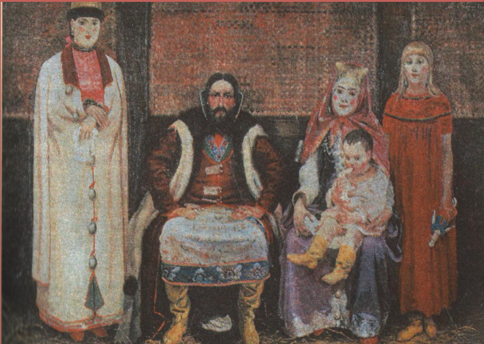
Рябушкин А. Семья купца XVII века.