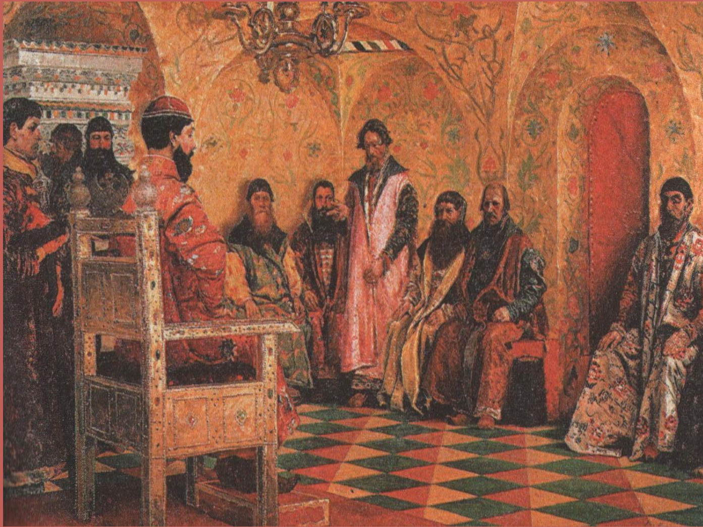
Рябушкин А. Боярская дума при Михаиле Романове