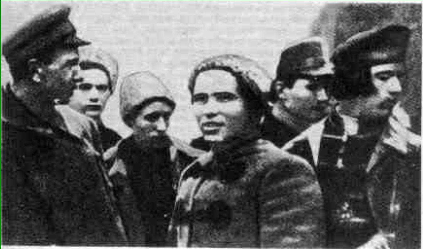
Нестор Махно зі своїм штабом