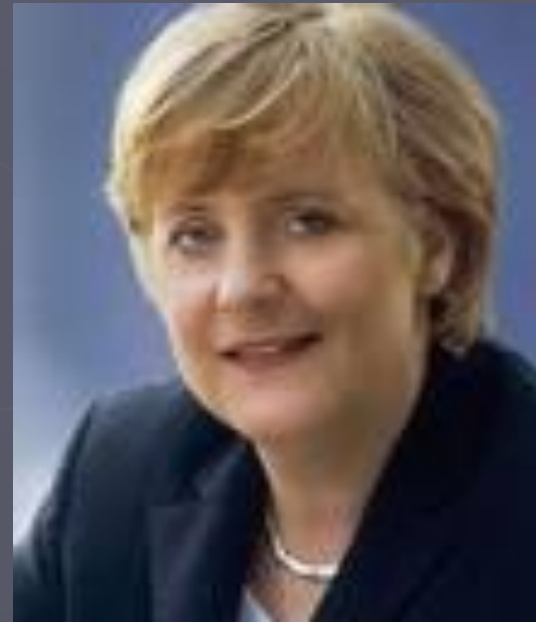
Ангела Меркель – Канцлер Германии