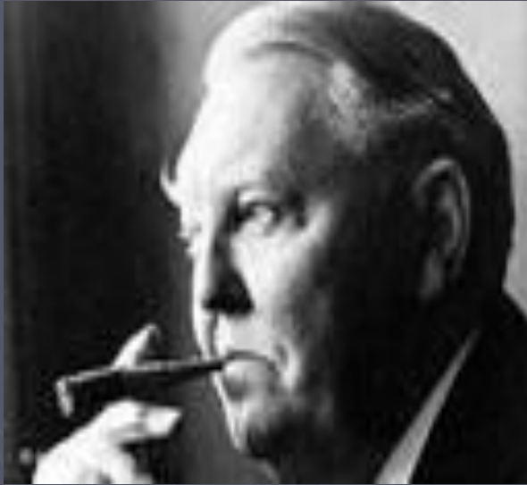
Л. Эрхард. Премьер – Министр ФРГ.