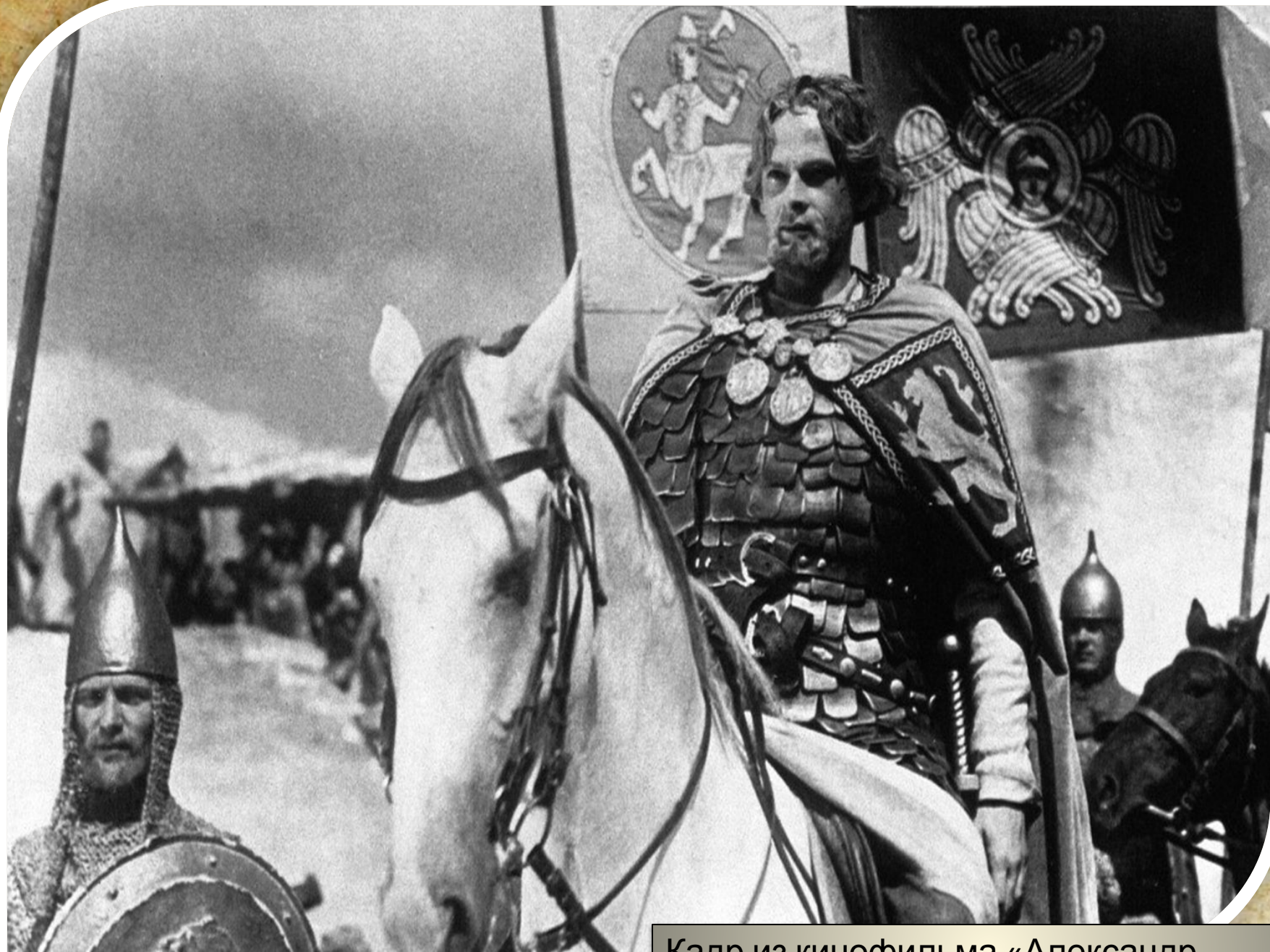
Кадр из кинофильма «Александр Невский»