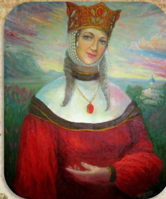
Мать - Ростислава Мстиславна

Александр Ярославович родился в 30 мая 1220 года в городе Переславле (ныне Переславль-Залесский), в княжестве своего отца Ярослава Всеволодовича (правнука Владимира Мономаха). Мать Александра – Ростислава (Феодосия) Мстиславна, рязанская княжна Торопецкая, дочь князя новгородского и галицкого Мстислава Удатного. Он был вторым сыном в семье после Федора.