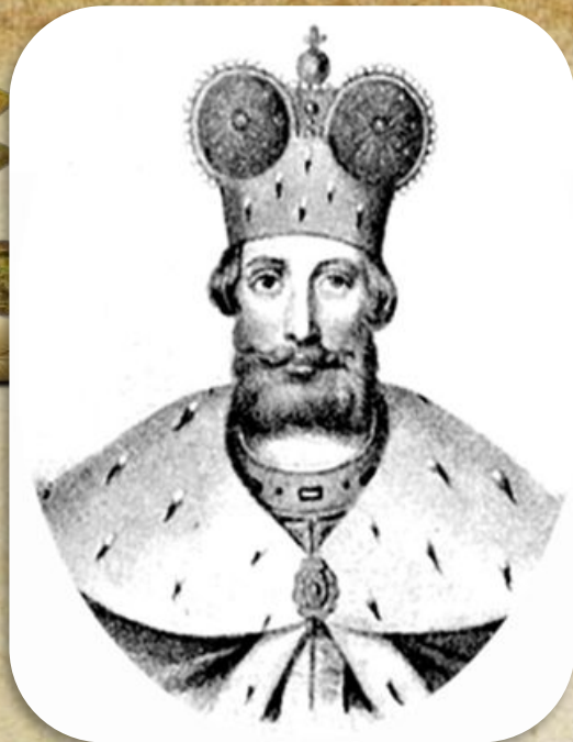
Отец - Ярослав Всеволодовичъ