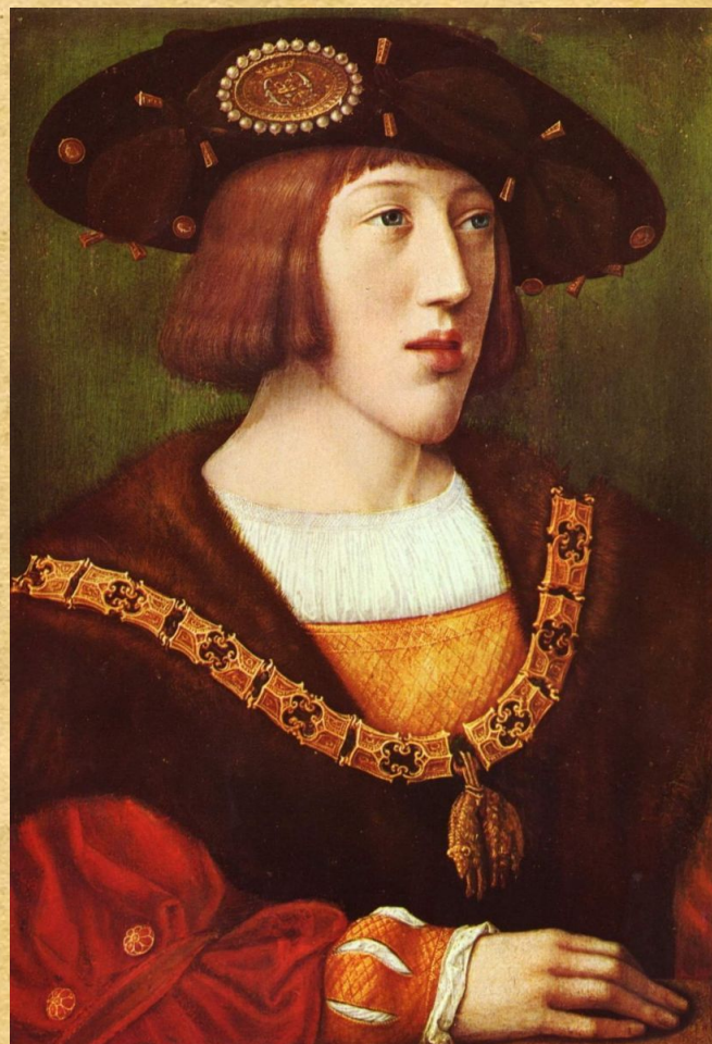
Портрет молодого Карла V