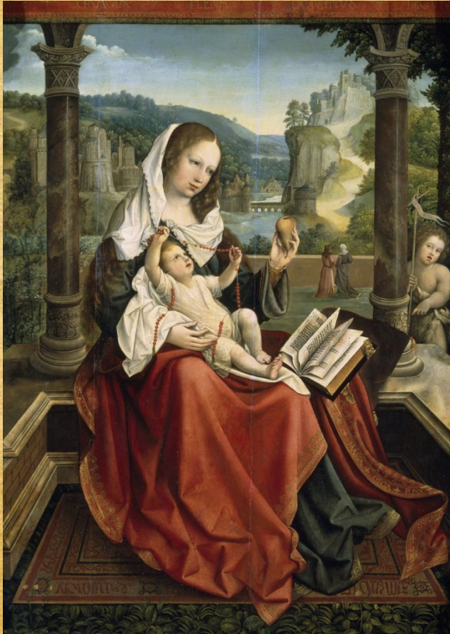
Мадонна с младенцем