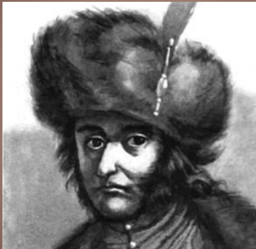
Лжедмитрий I – Григорий Отрепьев