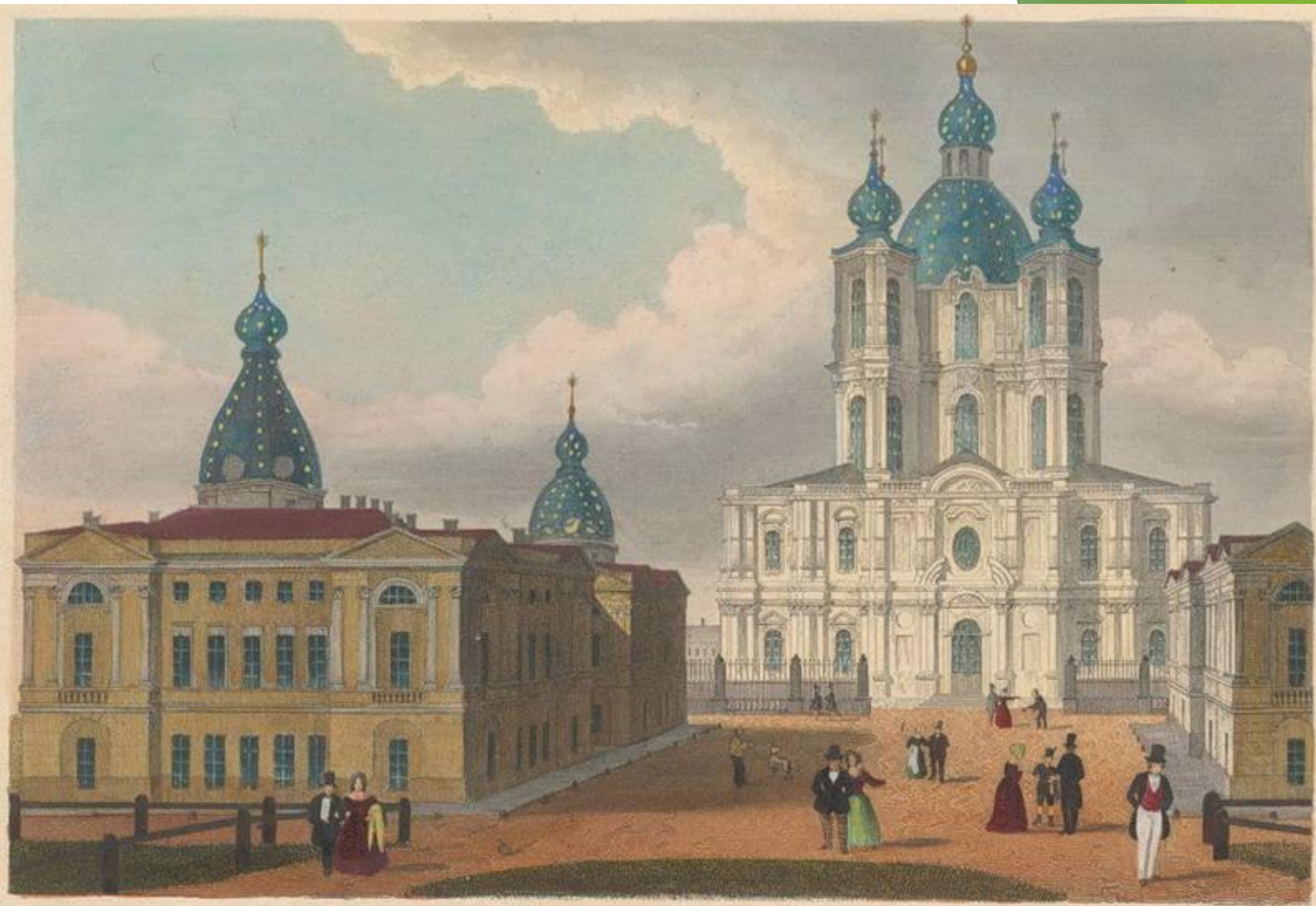
ДВЕРКОВІ СМОЛЕНСКО МОНАСТЫРНЯ