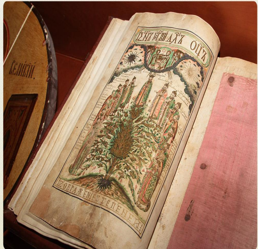
Мария Колосова | Российская государственная библиотека