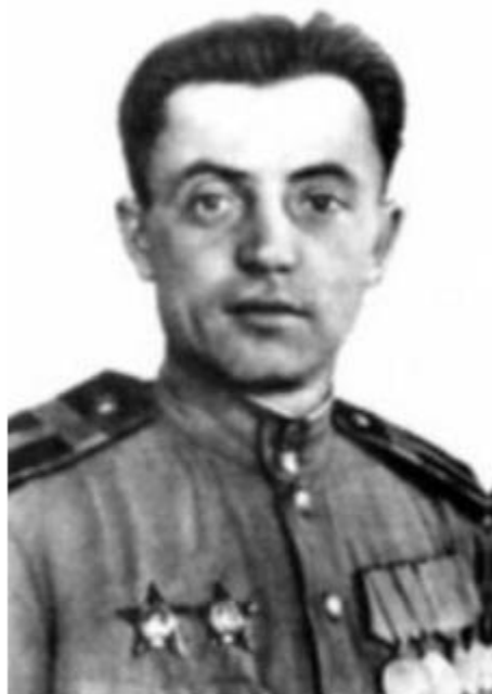
Яков Федорович Павлов

Дом Павлова после окончания Сталинградской битвы. заднем плане — Мельница Гергарта