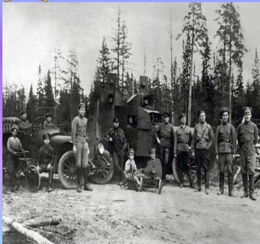
Красноармейцы 1-ой бригады 18-й стрелковой дивизии Северного фронта у автоброневика «Коммунист» в районе Ночмаса на Кодыш-фронте, 1919 г.