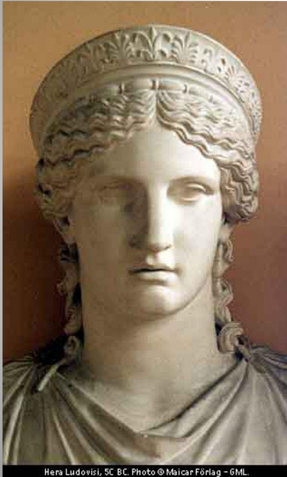
Hera Ludovisi, 5C BC.

Жена Зевса – Гера – величественная красавица, покровительница брака и супружеской верности. Все боги Олимпа чтут ее как царицу Олимпа. Но нередко посещает богиню горе: непостоянный Зевс часто изменяет ей, влюбляясь в земных красавиц и богинь. От злости и гнева царица преследует своих соперниц, насылая на них беды.