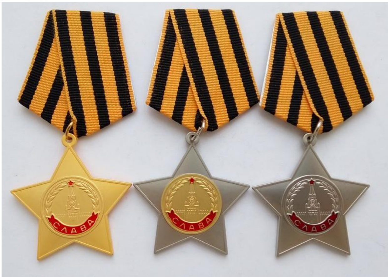
Орден Славы I , II и III степени