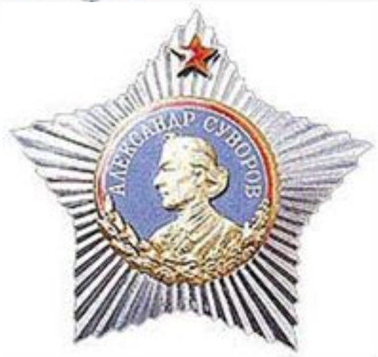
Орден Суворова I степени