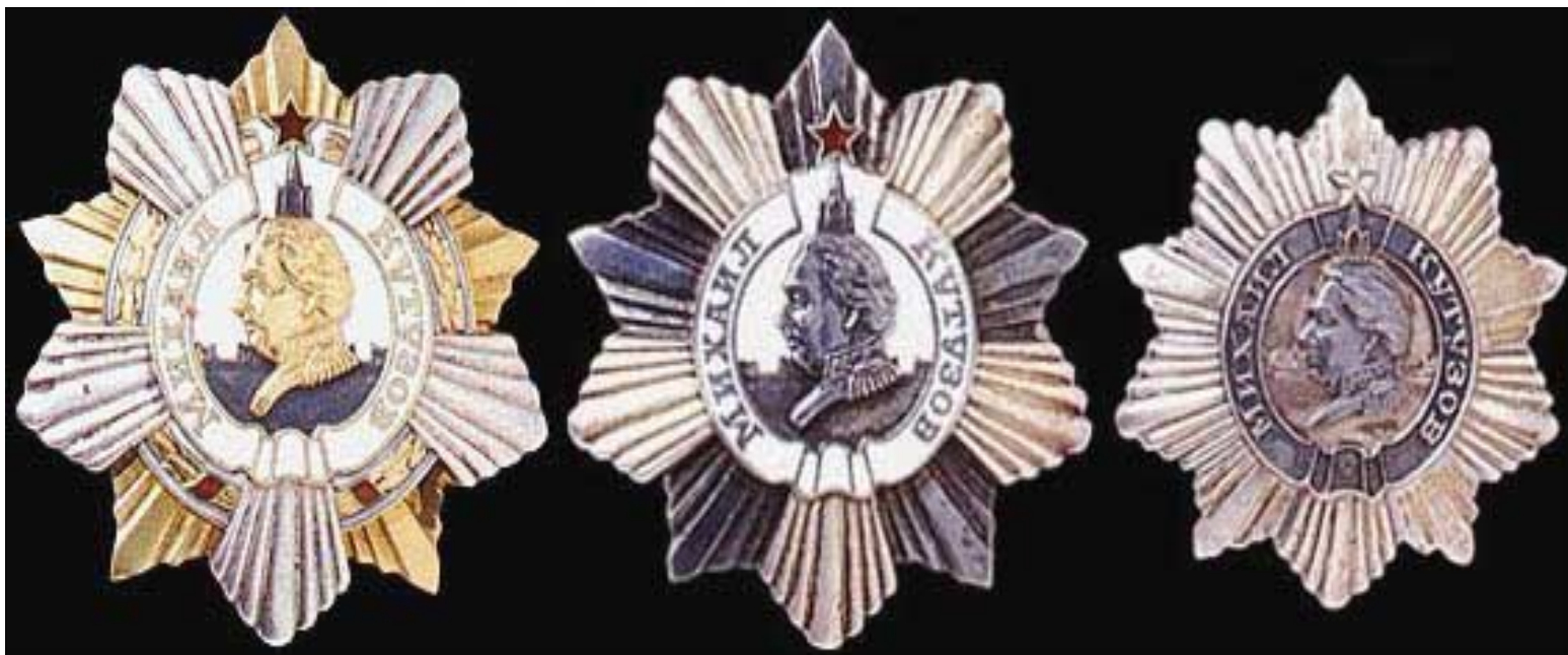
Орден Кутузова I , II и III степени