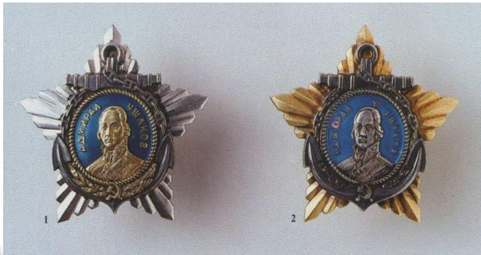
Орден Ушакова I и II степени