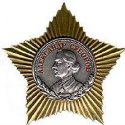
Орден Суворова II степени