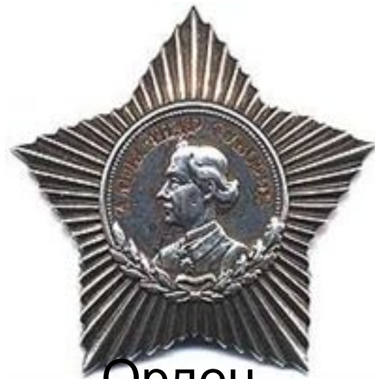
Орден Суворова III степени