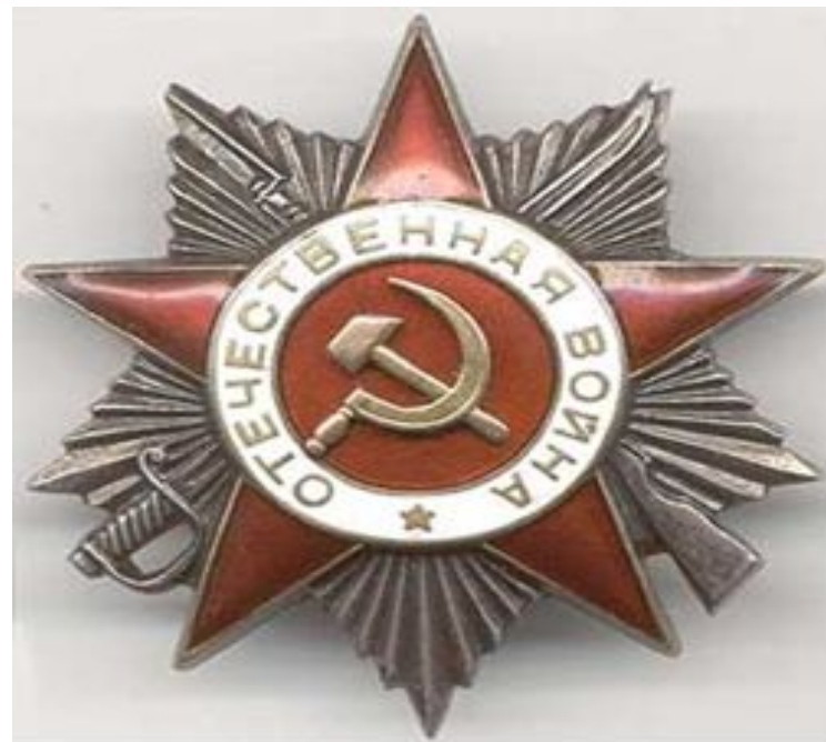
Орден Отечественной войны II степени