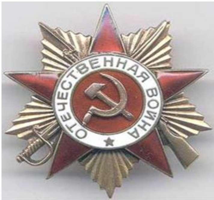
Орден Отечественной войны I степени.