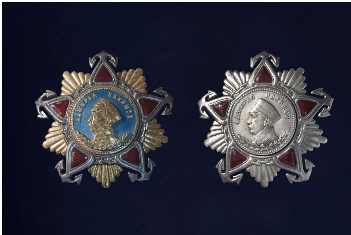
Орден Нахимова I и II степени