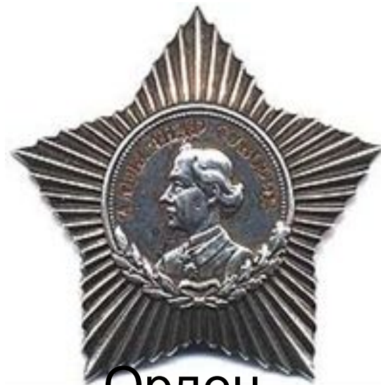
Орден Суворова III степени