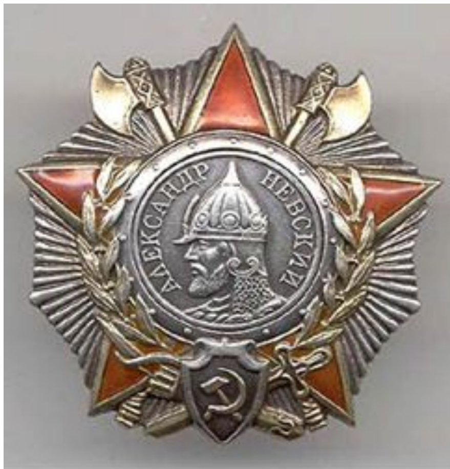
Орден Александра Невского