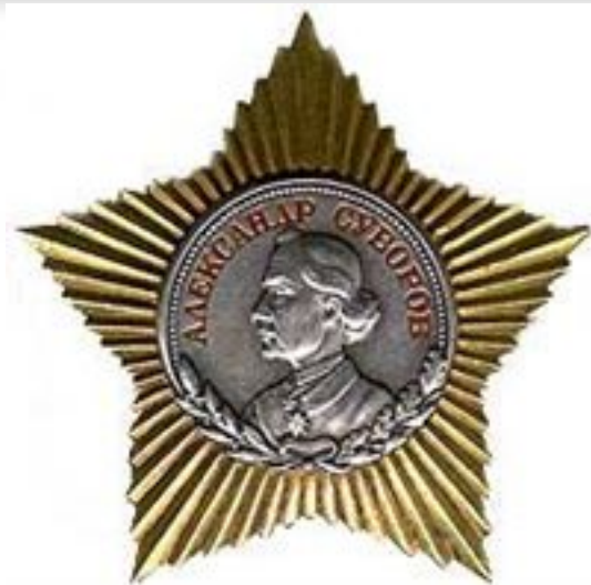
Орден Суворова II степени