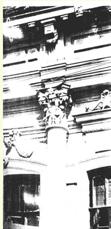
Фрагмент главного фасада.

На первом этаже находилось пряничное производство, на втором – кондитерский магазин и квартира хозяина.