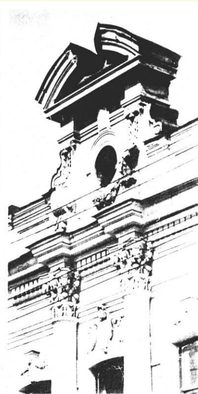
3. Фрагмент главного фасада.