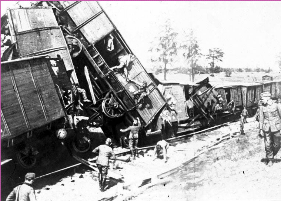
Крушение немецкого военного эшелона, организованного одним из отрядов партизан

По своим масштабам «Рельсовая война» приобрела стратегический характер. Начатая в ночь на 3 августа 1943 года в разгар ожесточенного сражения на Курской дуге, она развернулась на огромном пространстве протяженностью по фронту на 1000 км и в глубину 750 км, и продолжалась до середины сентября 1943 года. В операции приняли участие около 100 тысяч бойцов партизанских формирований и десятки тысяч человек мирного населения.