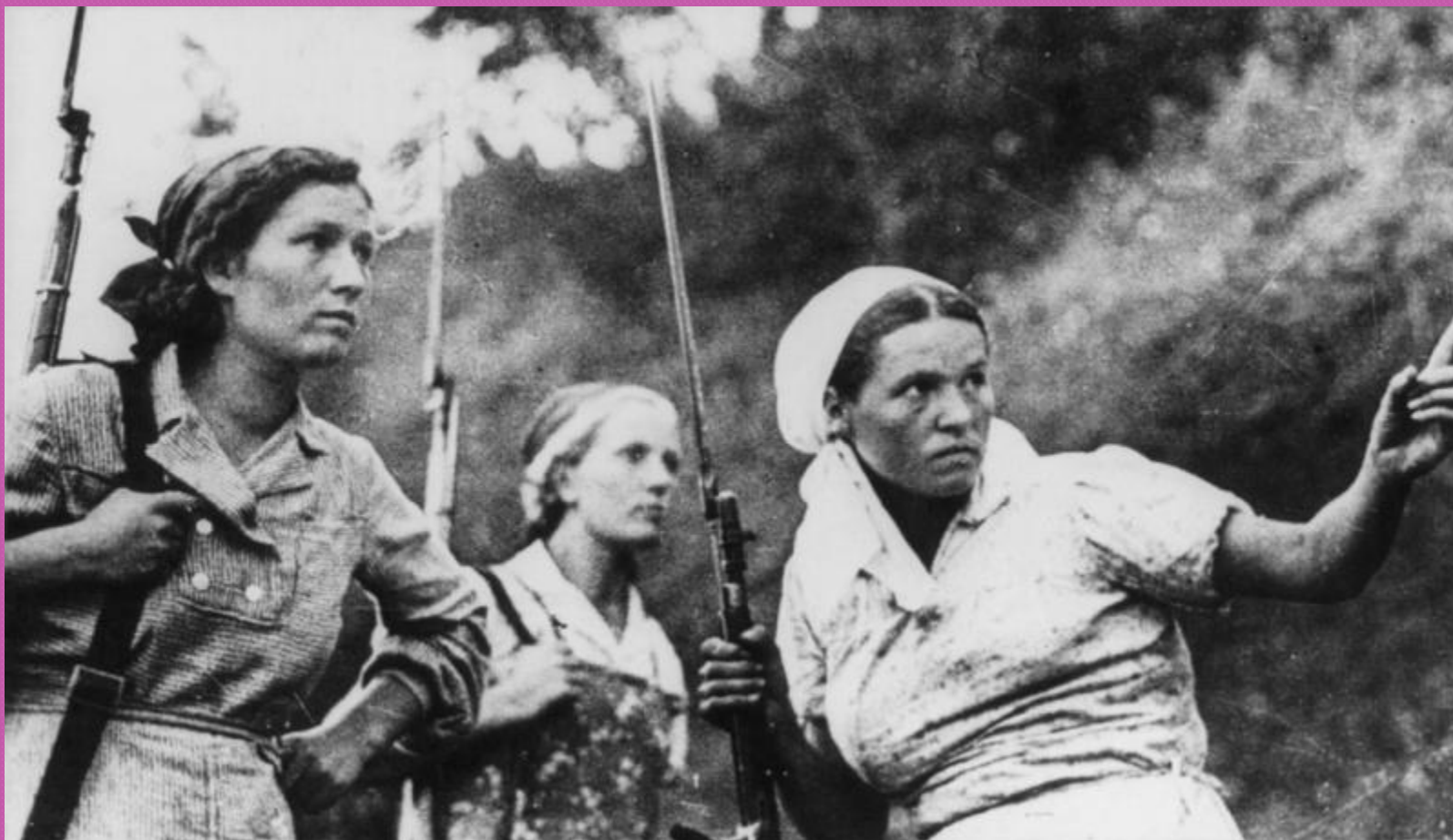
Советские женщины-партизанки, вооруженные винтовками Мосина с примкнутыми штыками.

на вооружении партизанских отрядов преобладало легкое стрелковое оружие, автоматы, пулеметы и минометы.