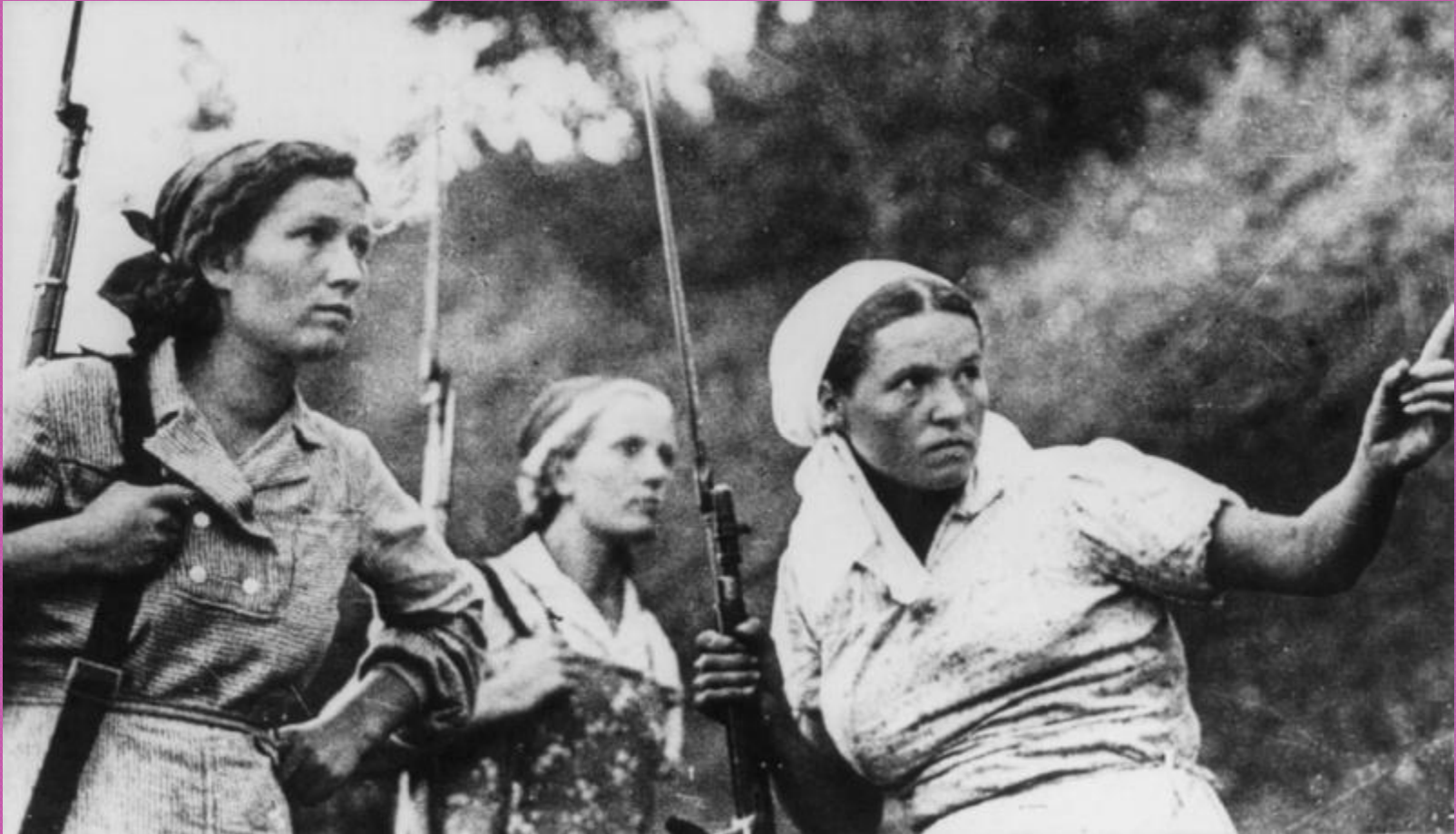
Советские женщины-партизанки, вооруженные винтовками Мосина с примкнутыми штыками.

на вооружении партизанских отрядов преобладало легкое стрелковое оружие, автоматы, пулеметы и минометы.