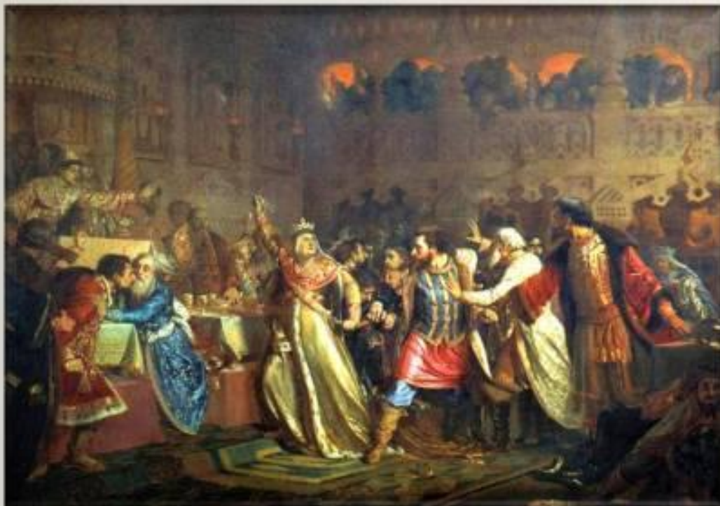
Фрагмент картины П.П. Чистякова